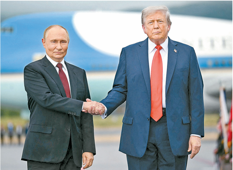
Após encontro, Putin classificou o diálogo como "construtivo"

O último encontro entre líderes dos dois países foi em 2021, quando Joe Biden estava na Casa Branca. “É importante e necessário que nossos países virem a página e retornem à cooperação. Gostaria de esperar que o acordo que alcançarmos juntos nos ajude a aproximar esse objetivo e abra caminho para a paz na Ucrânia”, afirmou Vladimir Putin. Em uma fala especialmente curta, o presidente americano, por sua vez, disse acreditar que "Putin está tão interessado em acabar com o conflito quanto ele". Mas ponderou que ainda "resta muito a ser feito" até um acordo conciso. Trump disse que telefonará aos líderes europeus e à Ucrânia para relatar o que foi conversado.