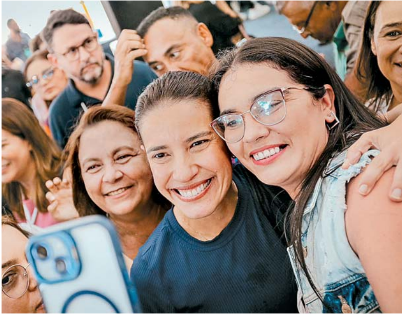
Gestora: “Não me venham com violência política de gênero”