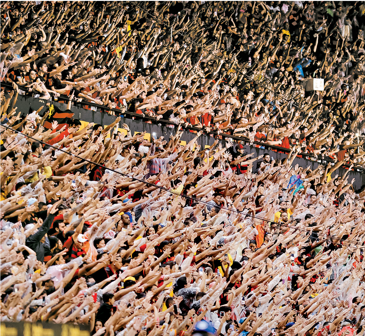
Com expectativa de ingressos esgotados, Sport tem jogo contra São Paulo, na Ilha do Retiro, para confirmar evolução

Se na rodada passada o Sport fez valer o retrospecto positivo atuando na Arena do Grêmio, desta vez, perante o São Paulo, Daniel Paulis-