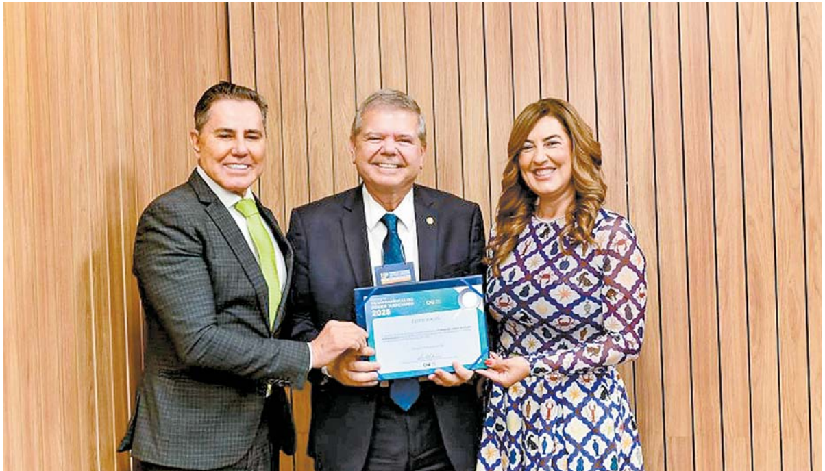
Presidente da Corte recebeu certificado de cumprimento integral de metas

bilização de informações de maneira clara e padronizada, garantindo maior facilidade e confiabilidade no acesso aos dados. Os itens de avaliação estão distribuídos em