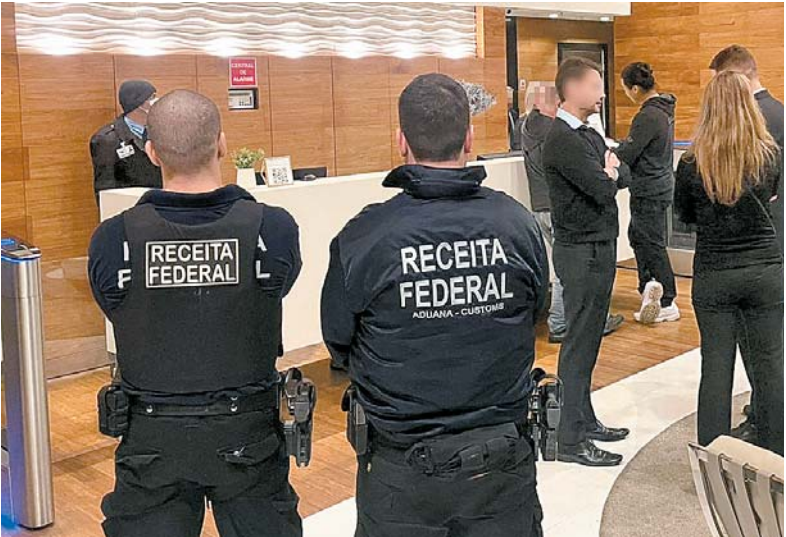
Empresas sonegavam impostos e adulteravam combustíveis

centenas de empresas em nome de "laranjas", em especial familiares, para as práticas fraudulentas. De acordo com o MP, foram identificadas ligações do grupo de Mourad com o PCC. A investigação começou em 2023. Na ocasião, a Polícia Rodoviária Federal interceptou o transporte ilegal de uma carga de metanol. O material era desviado de empresas químicas e entregue clandestinamente em postos de gasolina na Grande São Paulo para adulterar combustíveis, gerando lucros bilionários ao PCC.