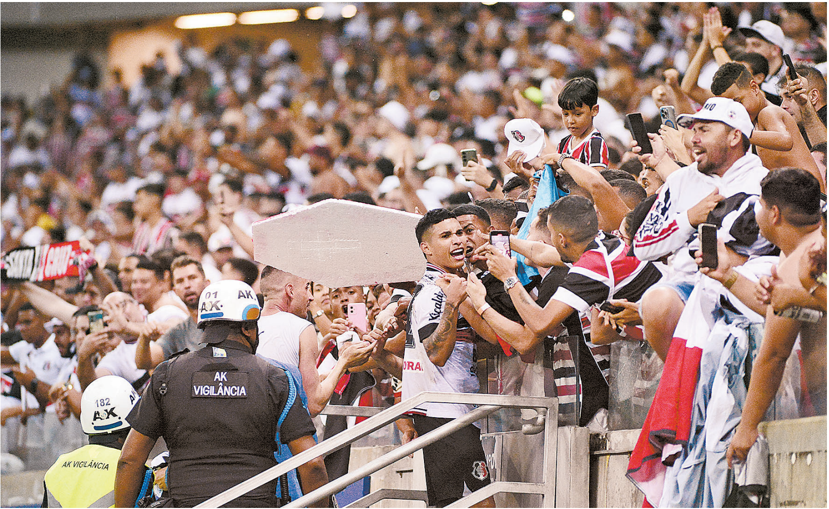
Partida de amanhã contra América-RN, a partir das 19h, pode ser o maior público do Santa Cruz na Arena de Pernambuco