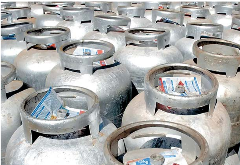
Devem ser distribuídos 58 milhões de botijões até 2026

O Aglomerado da Serra é a maior favela de Belo Horizonte e uma das maiores de Minas Gerais e está localizada na zona sul da capital mineira, na encosta da Serra do Curral. Trata-se de um grande com-