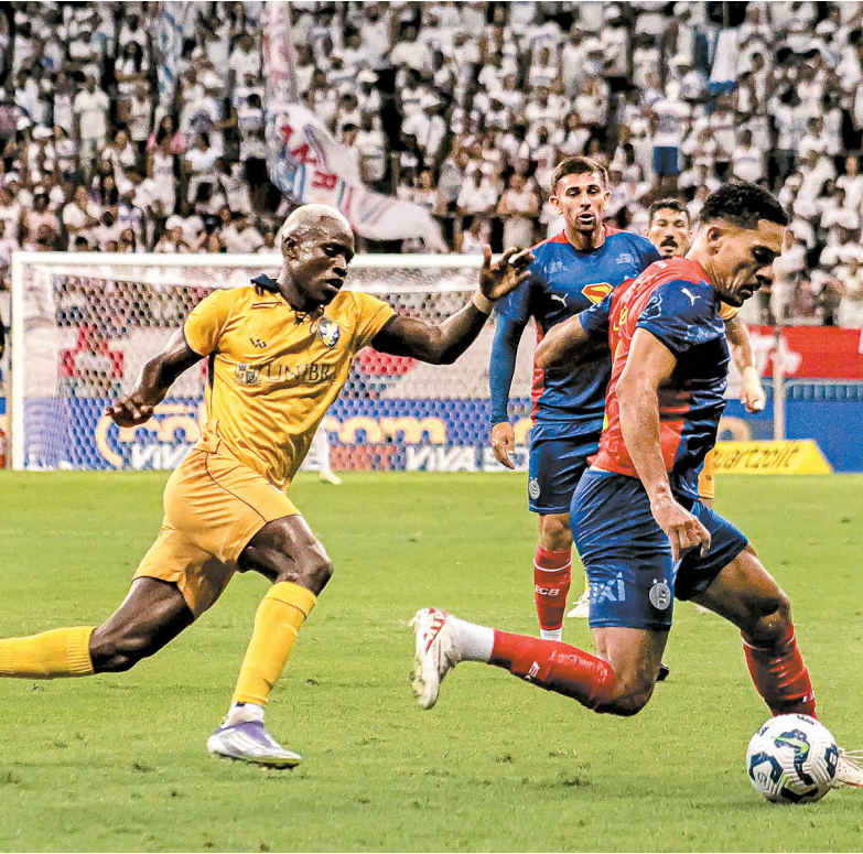
No jogo de ida, na Fonte Nova, baianos venceram por 3x2