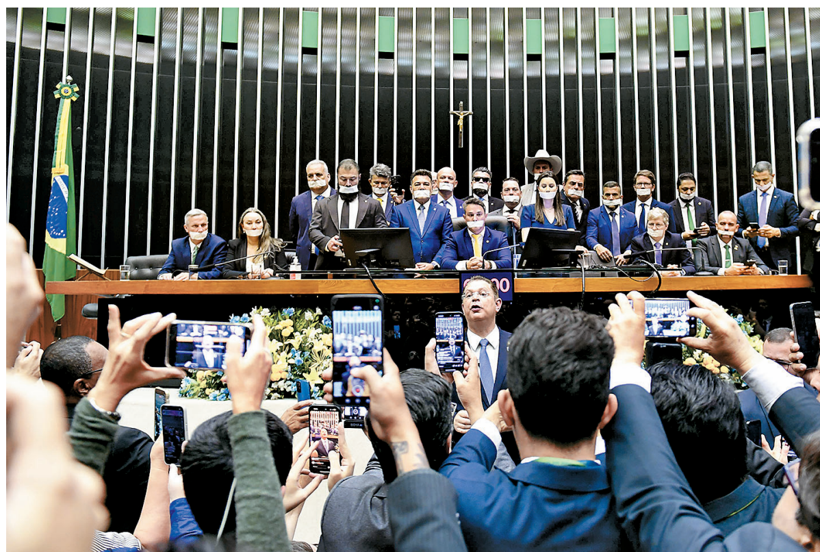
Parlamentares de oposição ao governo, com esparadrapos na boca, ocuparam a Mesa Diretora

A oposição espera barrar o processo no STF por tentativa de golpe de Estado, alegando ser uma perseguição política. Além de enfrentar esse processo, o ex-presidente Jair Bolsonaro é investigado no inquérito que apura a atuação dele e do filho, o deputado Eduardo Bolsonaro (PL-SP), junto ao governo dos Estados Unidos, para promover medidas de retaliação aos ministros do STF em razão do julgamento