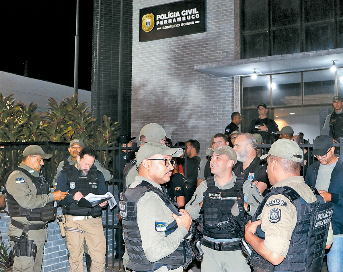
Presença efetiva das forças de segurança é apontada como um dos fatores para redução de homicídios

Segundo a SDS-PE, nos sete primeiros meses do ano, Pernambuco contabiliza 253 mortes violentas intencionais a menos do que o registrado no mesmo período em 2024. O número representa uma