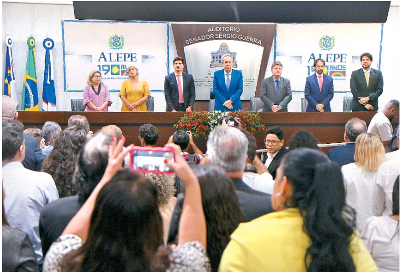
Evento teve participação de familiares e lideranças políticas