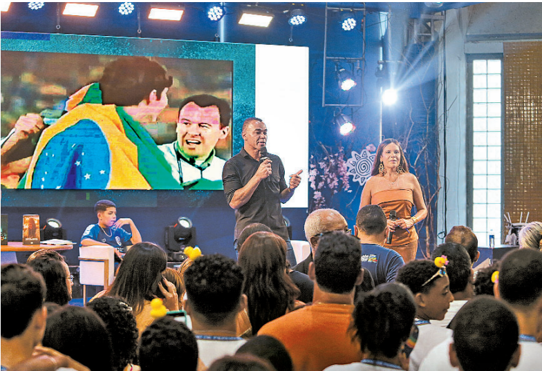
Ex-jogador Cafu bateu papo com público sobre sua carreira

mentou a falta de acerto para a compra da SAF do Náutico e comentou sobre Ancelotti na Seleção Brasileira durante evento. O ex-jogador era um dos nomes que participaram da proposta do Consórcio Timbu que buscava comprar 90% das ações do Náutico. O negócio não andou após divergências junto ao Conselho Deliberativo alvirrubro, no final de abril. “Seria ótimo se tivesse dado cer-