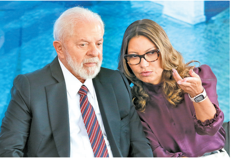
Gestor e primeira-dama terão compromissos em datas distintas

ma, no Litoral Norte, onde visitará uma creche e entregará computadores a representantes das colônias de pescadores da região. Ela visita ainda a Colônia Z-10, e se desloca pelo Canal de Santa Cruz para reconhecimento das atividades econômicas ligadas à pesca artesanal.