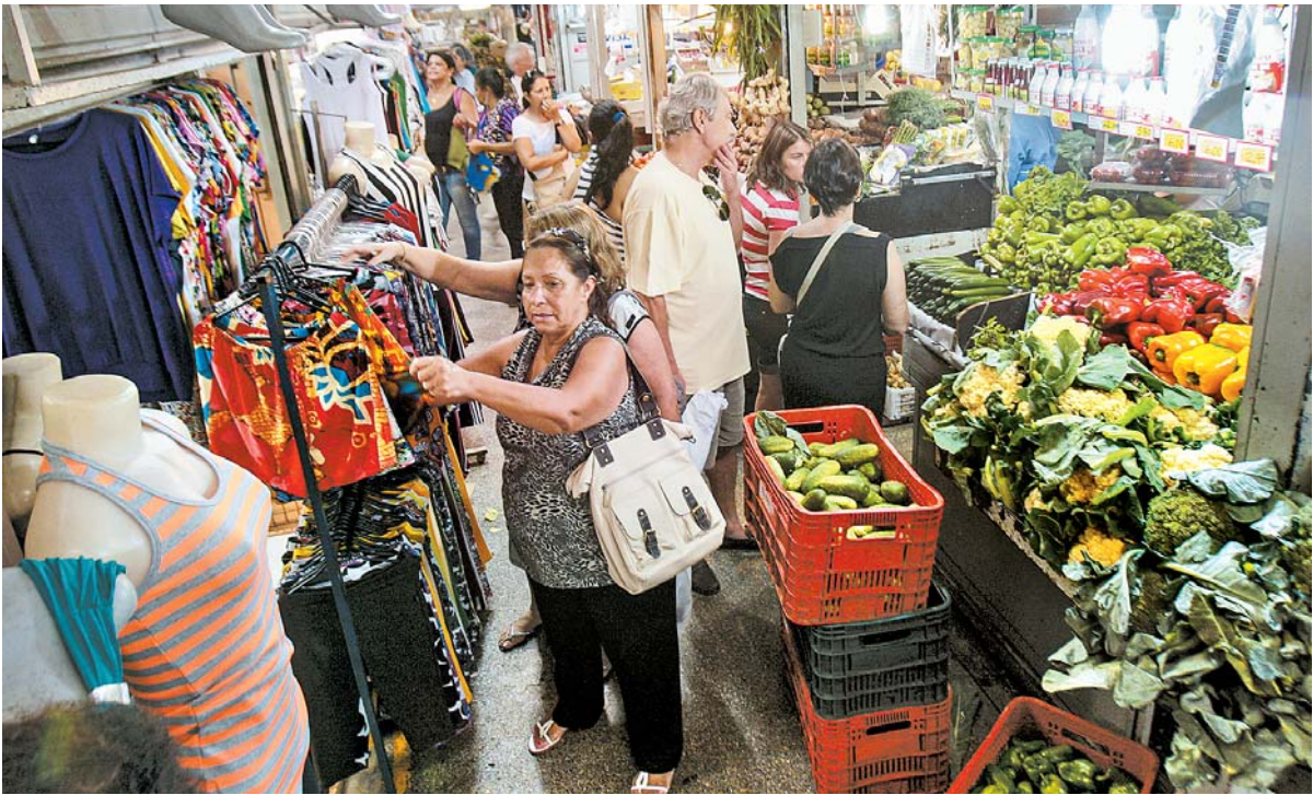
Para 2026, expectativas de queda de inflação se mantêm há quatro semanas, quando chegou a 4,5%

Mesmo com a desaceleração inflacionária dos últimos meses, o índice acumulado em 12 meses alcançou 5,35%, ficando pelo sexto mês seguido acima do teto da meta de até 4,5%. Esse período de seis meses acima de 4,5% configura estouro da meta pelo novo regime adotado em 2024. Para alcançar a meta de inflação, o BC usa como