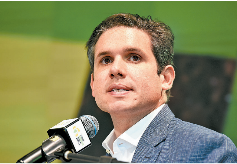
Deputado participou ontem do Fórum Nordeste 2025, no Recife

O parlamentar ainda negou que tenha conversado com o presidente Luiz Inácio Lula da Silva (PT) sobre uma possível cassação do mandato do deputado federal Eduardo Bolsonaro (PL). Lula, por sua vez, já havia declarado que a cassação do filho 03 do ex-presidente Jair Bolsonaro é necessária, considerando-o um “traidor da pátria”. “Tenho uma ótima relação com o presidente Lula. Todas as vezes que nos encontramos, tratamos de diversos assuntos de interesse do país, mas esse especificamente não”, pontuou. Motta garantiu que o processo de Eduardo será conduzido obedecendo o regimento e dando tratamento igual a todos os deputados e deputadas.