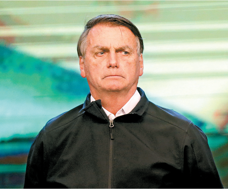
Ex-presidente decidiu não comparecer ao Supremo