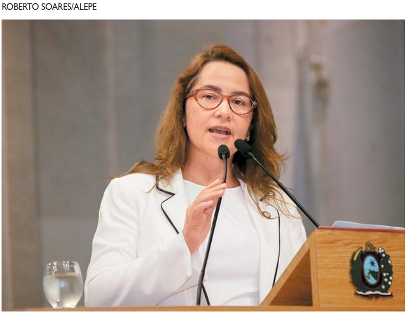
Legisladora defendeu que estatuto da sigla precisa ser obedecido