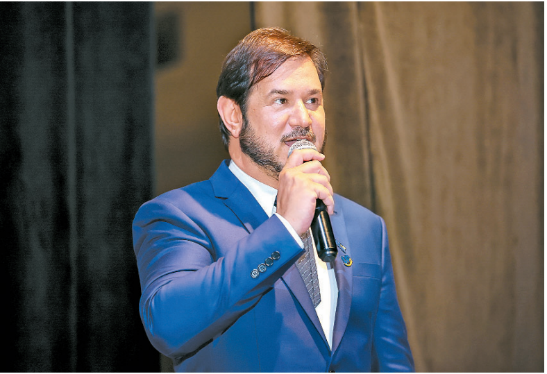
Dirigente partidário se defendeu por uma nota à imprensa

de cargos ocupados no Governo Federal movimento legítimo, democrático e amplamente debatido nas instâncias partidárias. Tal “coincidência” reforça a percepção de uso político da estrutura estatal