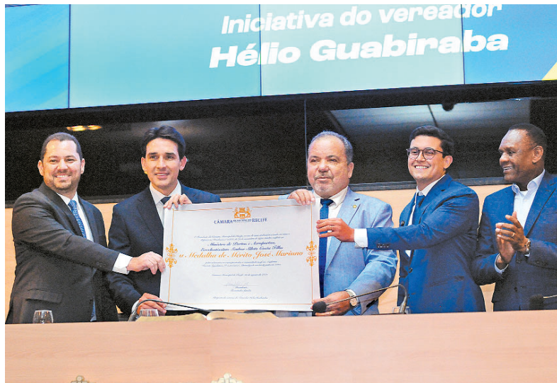
Ministro relembrou sua ligação com o Legislativo recifense

Sessão solene realizada ontem, na Câmara do Recife, reuniu autoridades municipais, estaduais e federais e destacou a trajetória política do ministro de Portos e Aeroportos