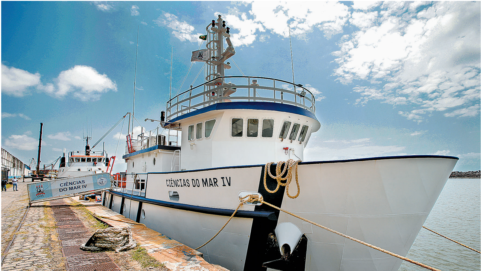
Navio-Laboratório de Ensino Flutuante (LEF) Ciências do Mar IV partiu do Recife, ontem, rumo à foz do Rio São Francisco

embarcação. Fabricado em fevereiro de 2014, o Ciência do Mar IV tem 32 metros de comprimento e possui capacidade para 26 pessoas, sendo nove tripulantes e 17 pesquisadores/alunos. Ele conta com cinco camarotes, nomenclatura dada aos quartos dos tripulantes. A embarcação também tem o passadiço, nome dado à cabine em que fica o comandante e o imediato, a pessoa que reveza na direção do veículo marítimo. A autonomia dele é de até 15 dias ou 3.300 milhas náuticas. O navio possui três laboratórios.