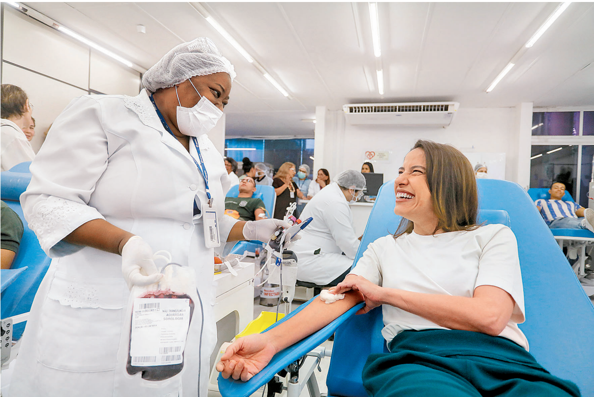
Raquel Lyra doou sangue e anunciou investimentos para reforma do prédio do Hemope

A presidente do Hemope, Raquel Santana, observou que a fundação nunca foi tão bem cuidada pelo governo do estado. Também não lembra de quando presenciou um gestor ter doado sangue na unidade. “Que esse exemplo se perpetue e atinja milhares de pernambucanos, para