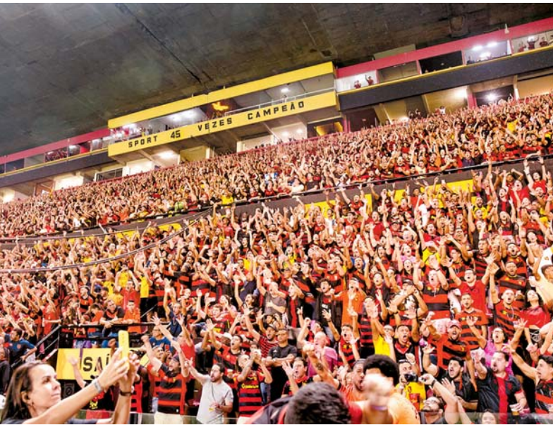
Como novo AVCB, Ilha agora poderá receber 27.325 pessoas

clube revelou que tem um projeto aprovado pelo Corpo de Bombeiros com objetivo de aumentar a capacidade da Ilha do Retiro para 32.500 lugares. Para chegar a esta capacidade, o Leão deve cumprir requisitos que exigem novas obras e adequações, orçadas em mais de R$ 5 milhões. Na última terça-feira, o Sport informou que concluiu a etapa inicial da reforma do primeiro andar da sede social, com a alocação de andaimes para o espaço e a retirada completa da cobertura antiga. A segunda fase da obra, por sua vez, marca a inserção da es-