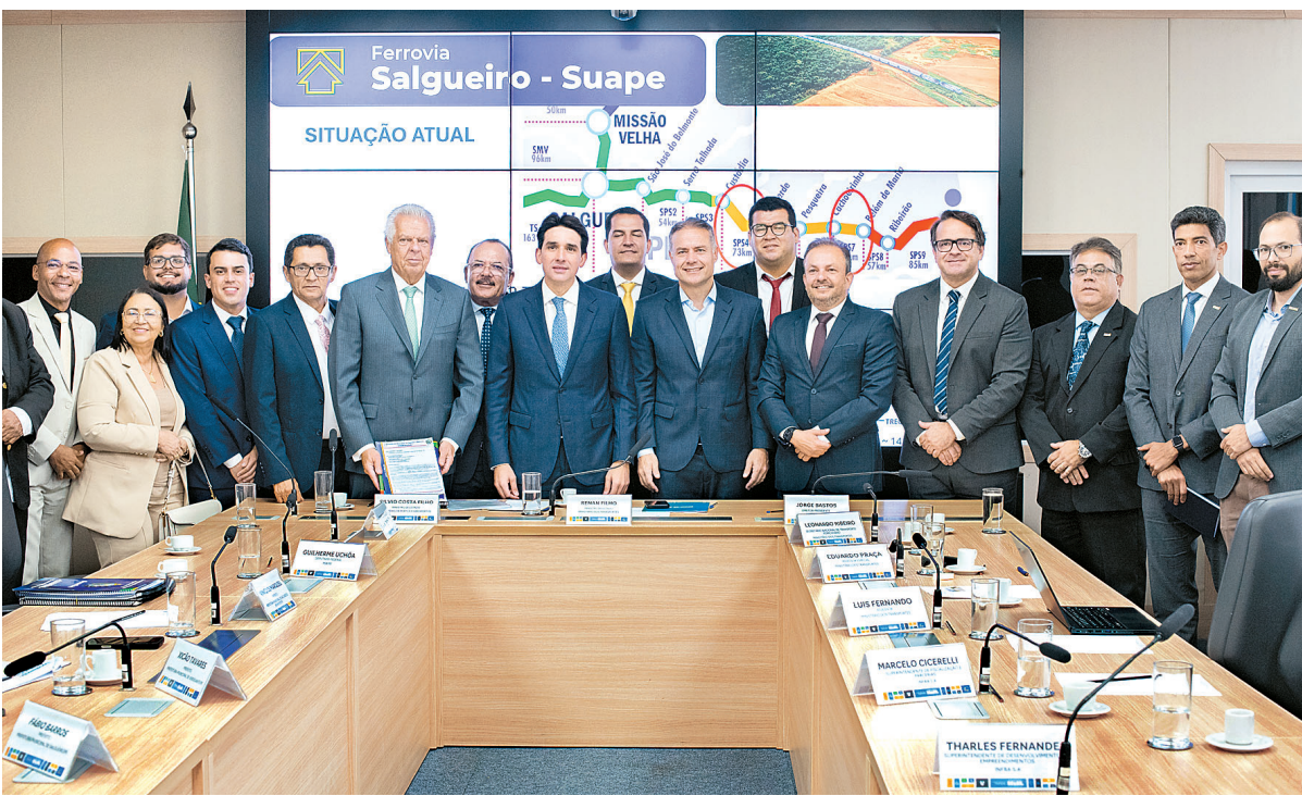
Implantação de dois portos secos ao longo da ferrovia em PE também entrou na pauta da reunião

De acordo com o ministro Renan Filho, a INFRA S.A. realizará um estudo técnico detalhado para avaliar a viabilidade da instalação dos portos secos em Salgueiro e outro no Agreste, que podem se tornar um importante ponto de escoamento da produção do interior gerando desenvolvimento, emprego e renda para a região. O ministro Silvio Costa Filho ressaltou que a retomada da Transnordestina vai abrir novas oportunidades de negócios, gerar empregos e renda para milhares de pernambucanos. “Estamos trabalhando para garantir que esse empreendimento histórico saia do papel e transforme a infraestrutura logística do nosso estado e do Nordeste. Essa obra é fundamental para o desenvolvimento do nosso estado, para Suape, mas, sobretudo, para o desenvolvimento do interior de Pernambuco”, comemorou Costa Filho. Após reunião, Renan Filho lembrou que retomar as obras em Pernambuco era um compromisso do governo do presidente Lula. “Vocês lembram que o presidente Lula não deixou tirar Pernambuco do desenvolvimento do Nordeste. E hoje estamos anunciando que esse pedaço de Custódia até Ar-