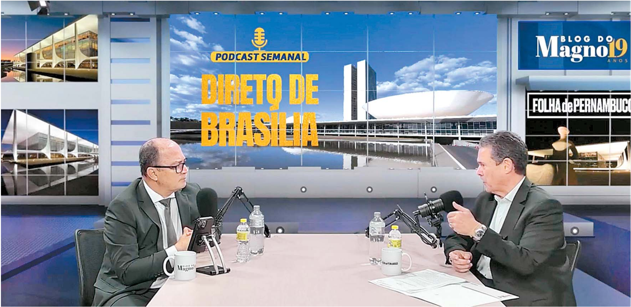
Ministro da Pesca e Aquicultura: “Vamos seguir perseguindo se houver fraude. Mas cada cuidado que a gente tem torna o programa mais sólido, rigoroso”

sando, estou otimista de que posamos reverter esse quadro.