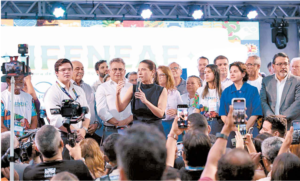
Governadora agradeceu empenho dos deputados e disse que enviará novas propostas para Alepe

Ao comemorar a aprovação do empréstimo de R$ 1,5 bilhão, a governadora atribuiu o feito à confiança dos deputados estaduais no trabalho dela. O projeto prevê o uso dos recursos na realização de obras como a do Arco Metropolitano e duplicação da BR-232, no trecho que