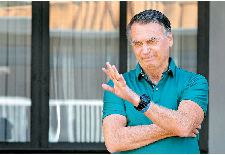
Ex-presidente cumprirá prisão inicialmente em regime fechado

passagem do regime fechado para o semiaberto pode ocorrer a partir do cumprimento de 16% da pena. A mesma legislação, no entanto, estabelece uma progressão mais lenta, de 25% da pena, se "o crime tiver sido cometido com violência à pessoa ou grave ameaça".