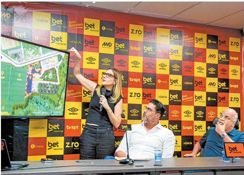
Apresentação de projeto do novo CT foi realizada ontem, na Ilha do Retiro

O novo Centro de Treinamento do Sport vai ter uma área de 13,9 hectares, com 3.500 m de área construída. O projeto prevê dois campos oficiais, um campo para treinamento de força e goleiros. O hotel para os atletas terá 36 quartos, refeitório para 100 refeições simultâneas e outras áreas para o