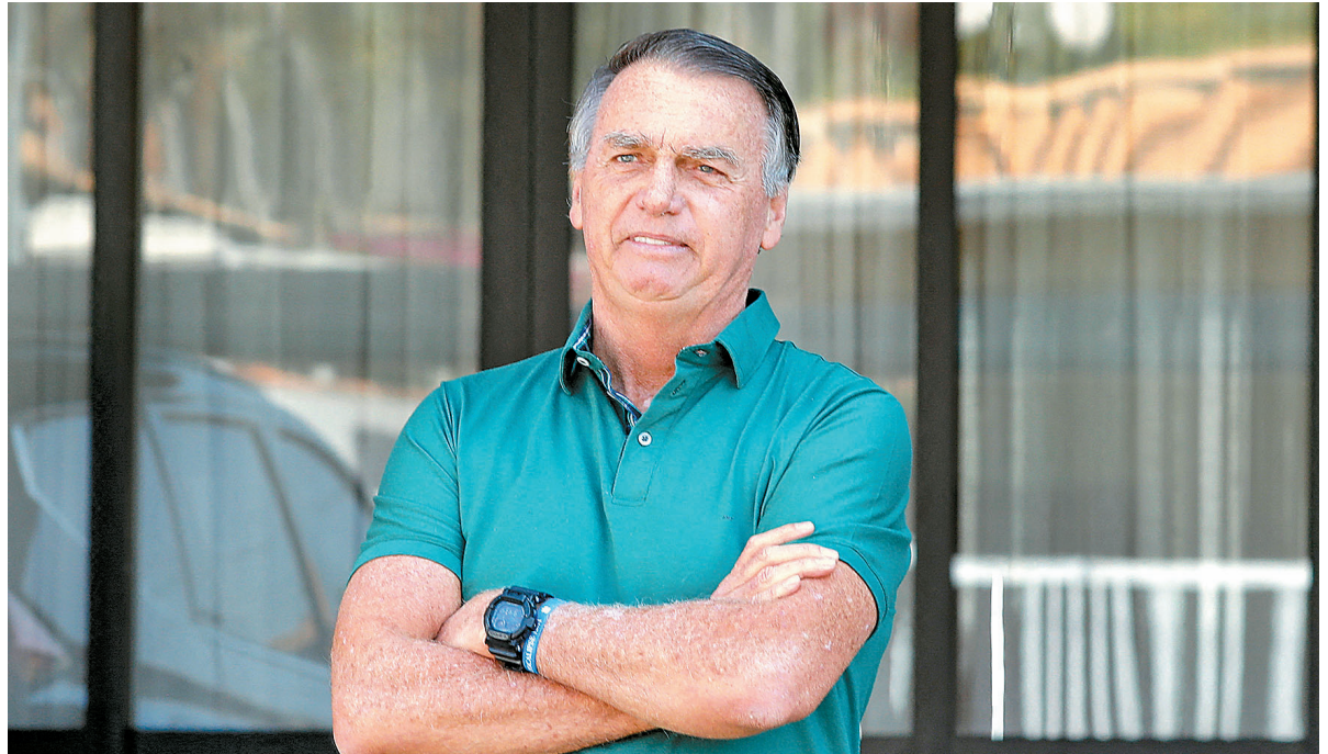
Com base na Lei da Ficha Limpa, Bolsonaro pode ficar inelegível pelos próximos 35 anos

Primeira Turma do STF determinou que o Superior Tribunal Militar julgue a perda de patente de Bolsonaro e seus aliados ligados às forças armadas