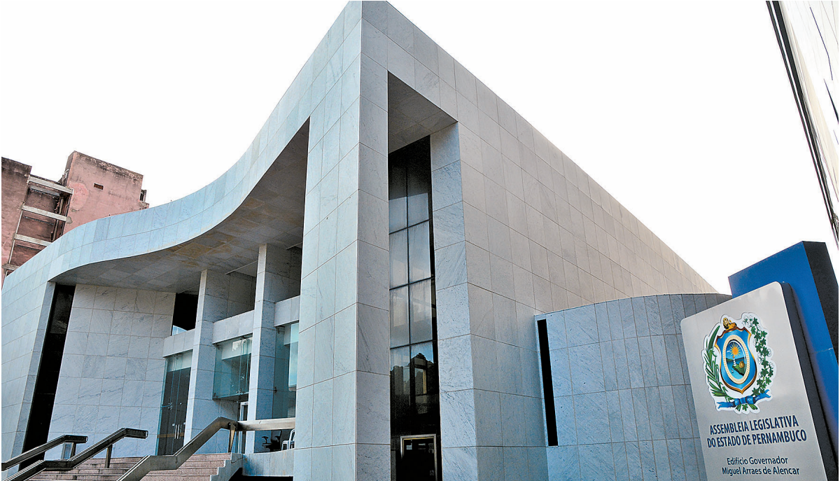
Assembleia Legislativa aprovou as propostas de forma célere ao longo desta semana