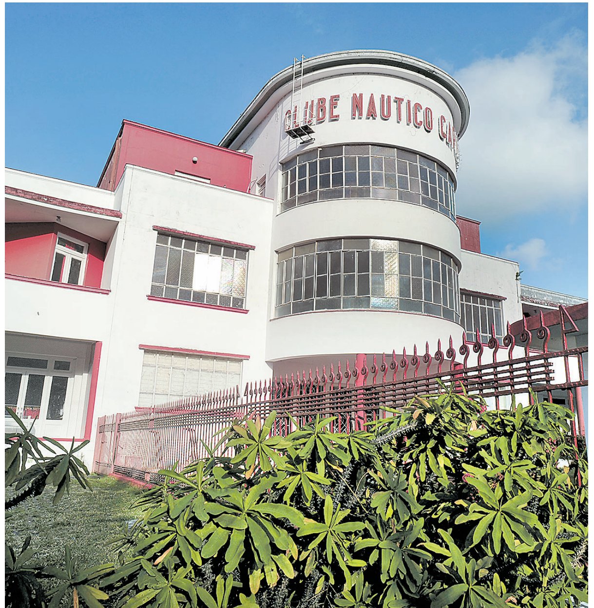
Comissão Eleitoral e Conselho Deliberativo do Náutico optaram por antecipar a votação