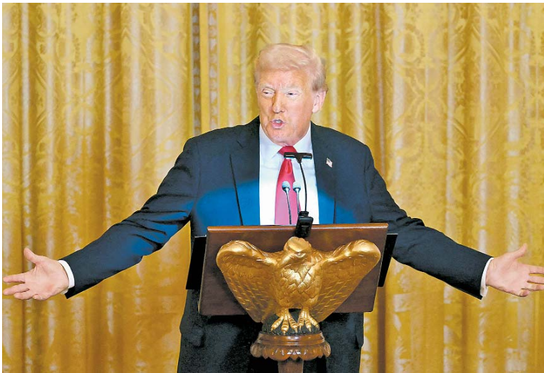
Trump: "Acho que teremos sucesso em terminar a guerra"

O presidente norte-americano afirmou ainda que se encontrará hoje com o líder ucraniano, Volodimir Zelenski, na Casa Branca, e que pode realizar "reuniões separadas" com ele e com Putin. "Acho que teremos sucesso em terminar a guerra na Ucrânia", declarou Trump, reforçando que o conflito "poderia culminar em uma Terceira Guerra Mundial", mas asse-