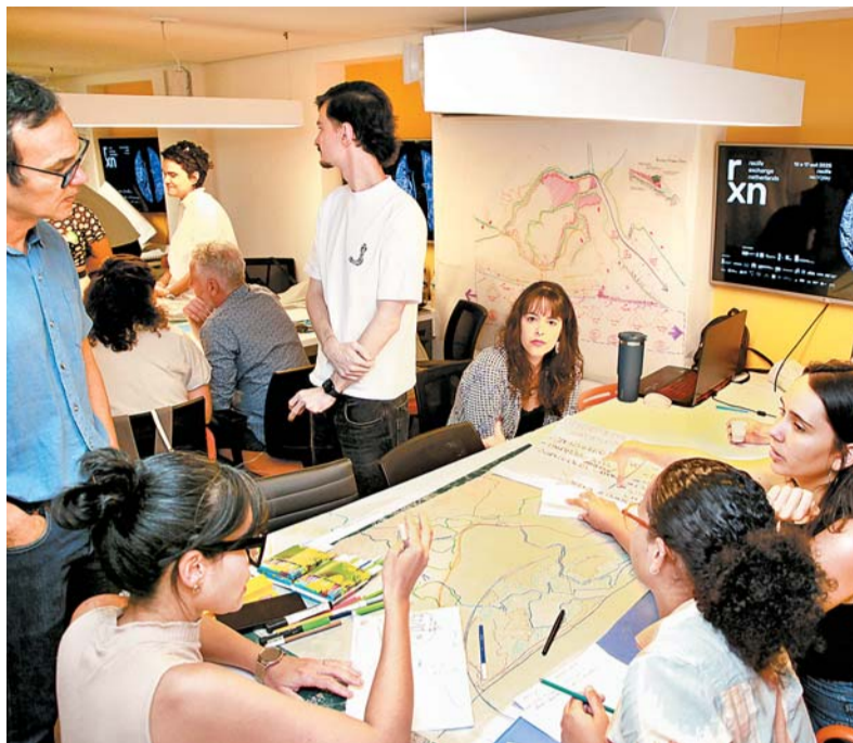
Evento teve como objetivo apresentar e discutir propostas para a capital pernambucana

que, novas ações seguem em estudo partindo de duas formas de lidar com a questão da água nas cidades: proteção e adaptação. A ideia de proteção busca criar barreiras que impeçam a entrada da água, enquanto a de adaptação permite integrar o fluxo hídrico ao ambiente de forma gradual.