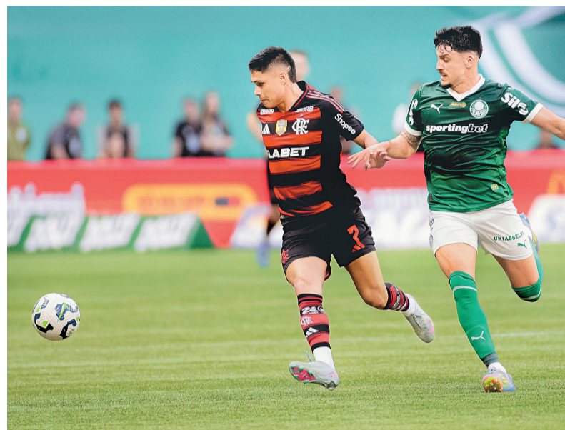
Rubro-negro e Alviverde prometem duelo agitado neste domingo

F lamengo e Palmeiras se encontram neste domingo, às 16h, no Maracanã, em duelo direto pelo título do Brasileirão. Os paulistas chegam ao confronto válido pela 29ª rodada com a liderança garantida: são 61 pontos contra 58 do clube da Gávea. Entretanto, mesmo que a equipe de Abel Ferreira perca no Rio de Janeiro, se manterá na frente na classificação por ter duas vitórias a mais que o rival carioca. O Flamengo chega à partida embalado pela boa vitória sobre o Botafogo, por 3x0, no Estádio Nilton Santos. Já o Palmeiras goleou o RB Bragantino, de virada, por