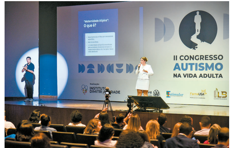
Congresso Autismo na Vida Adulta será realizado neste fim de semana