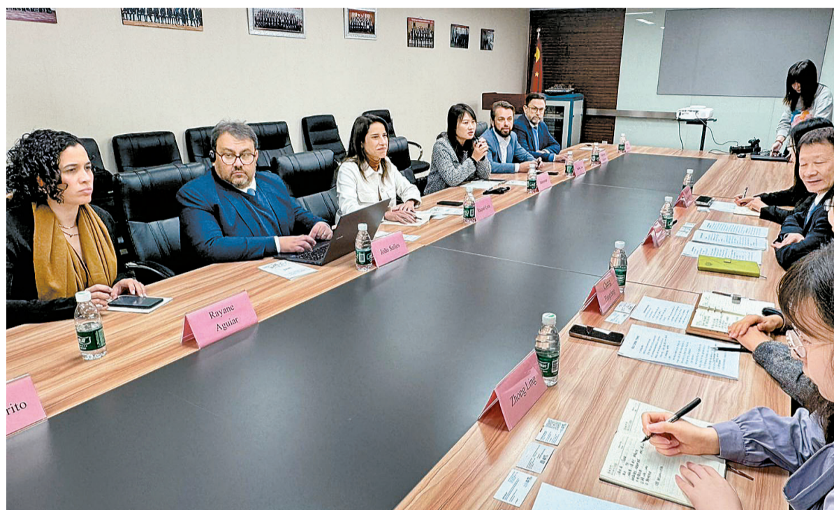
Encontros visam estreitar relação comercial com chineses diante de tarifas impostas pelos EUA