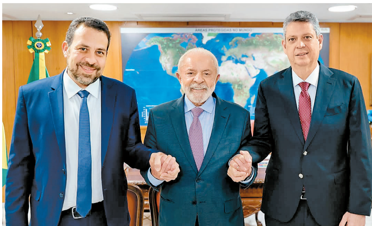
Nomeação foi oficializada ontem pelo presidente Luiz Inácio Lula da Silva

SECRETARIA DE ADMINISTRAÇÃO AVISO DE ABERTURA PROCESSO LICITATÓRIO COMPRAS.GOV Nº 90694/2025 Objeto: A presente licitação tem como objeto a formação de Ata de Registro de Preços para o fornecimento eventual de Medicamentos Controlados – Grupo 09, conforme especificações e quantitativos previstos no Termo de Referência (Anexo I), visando atender às demandas da Secretaria Estadual de Saúde de Pernambuco e suas unidades vinculadas e o HEMOPE . Valor máximo estimado R$ 3.396.581,81 . Início da disputa: 10/11/2025 às 09h. O Edital na íntegra está disponível no site www.compras.gov.br . Recomenda-se que os licitantes iniciem a sessão de abertura com todos os documentos necessários à classificação/habilitação previamente digitalizados. Outras informações (81) 3183 7796. Agente de Contratação AC - 41.