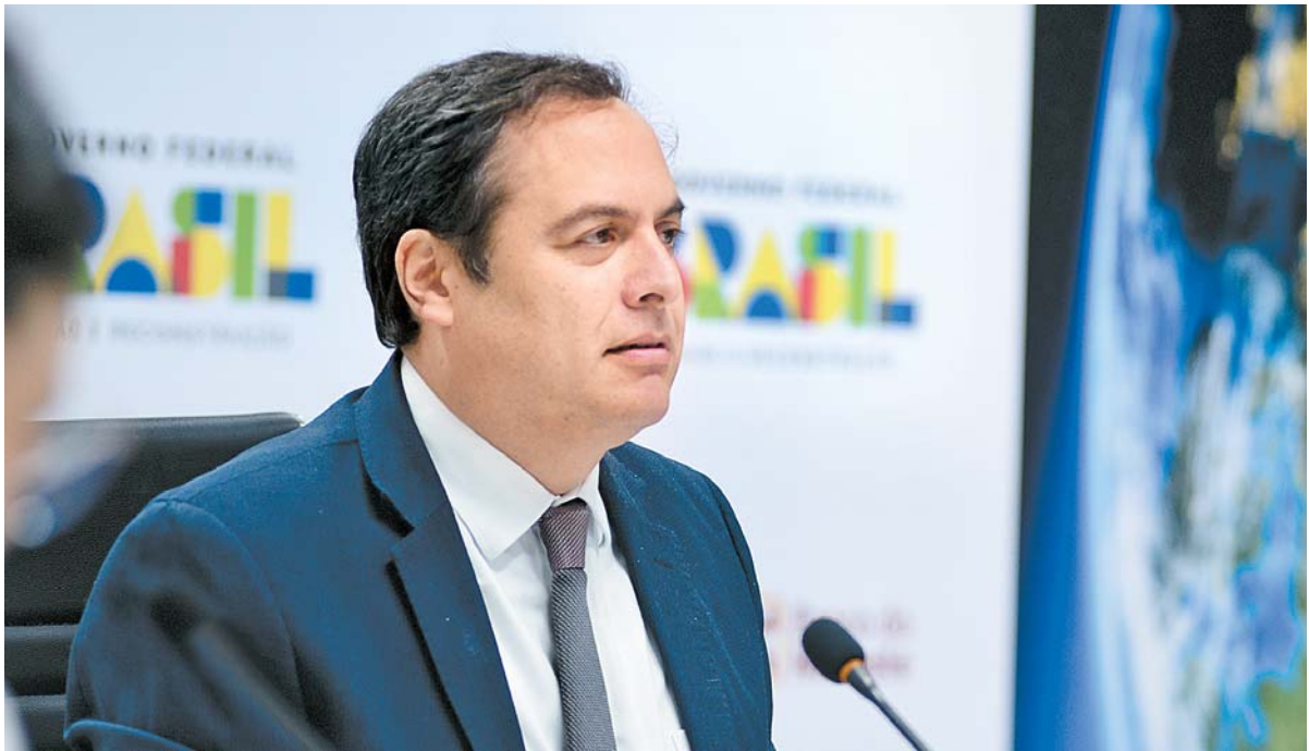
Pernambucano pode ser reconduzido ao comando da instituição em janeiro do próximo ano