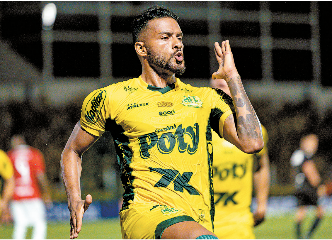
Reinaldo é o artilheiro do Mirassol na Série A, com 11 gols marcados