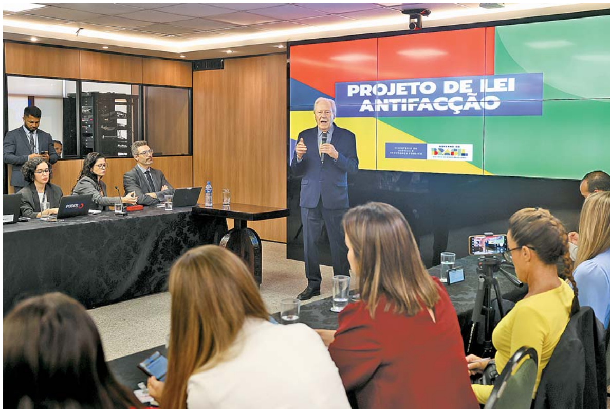
Ricardo Lewandowski: "Nós fizemos o possível para dar uma resposta nesse momento"

Outra ação prevista pela proposta é a de infiltração de policiais e colaboradores na organização