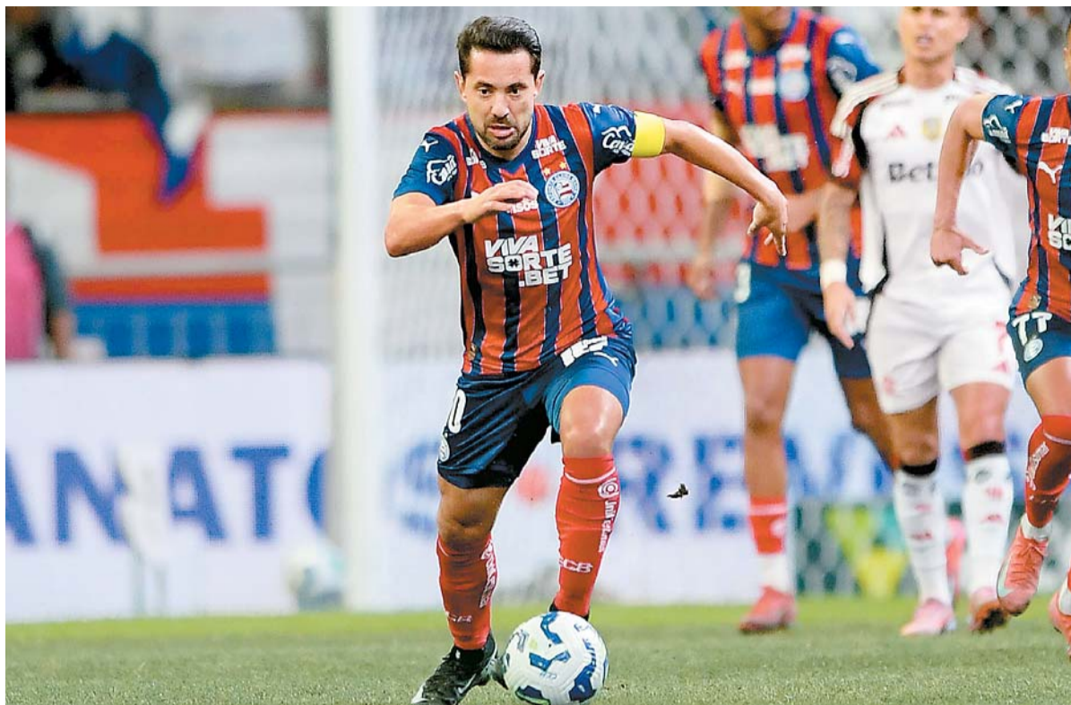
Everton Ribeiro participou da vitória do Bahia diante do Flamengo, no último domingo

"Oi, amigos. Preciso compartilhar uma notícia com vocês. Há cerca de um mês, fui diagnosticado com um câncer na tireoide. Hoje (segunda-feira) fiz a cirurgia e tudo correu bem, graças a Deus", revelou Everton Ribeiro, na Instagram, com uma imagem nos pés do Cristo Redentor, no Rio, com a