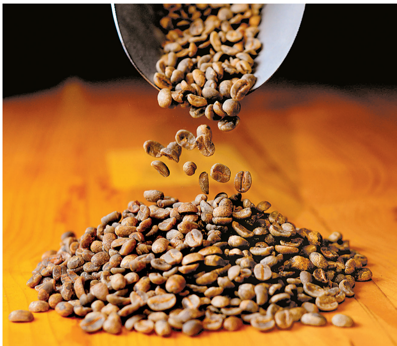
O café está entre os produtos afetados pelas tarifas elevadas