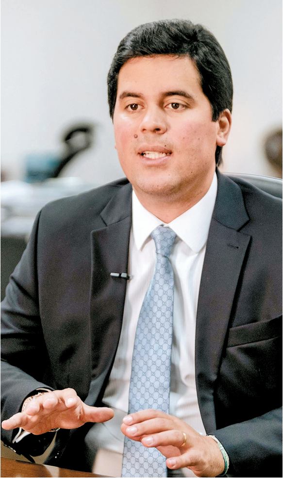
Lealdade de Sabino e Fufuca tem sido recompensada: Lula vem demonstrando apreço por ambos