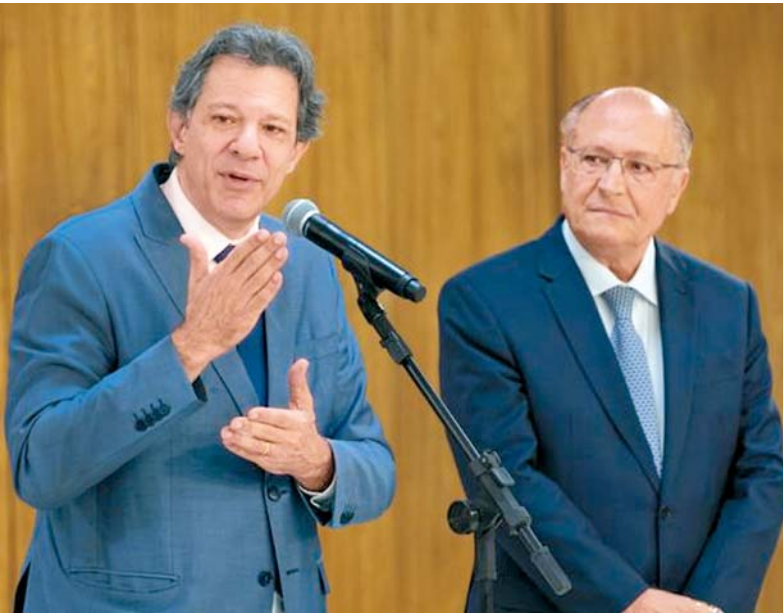
Haddad e Alckmin devem se reunir nos próximos dias com Lula

remeter os episódios apenas à Corregedoria e foi criticado por líderes partidários. De acordo com a Corregedoria, Pollon foi apontado como o caso mais grave e pode ser suspenso por 90 dias, por ataques à Presidência da Câmara, e por mais 30 dias, por ter bloqueado fisicamente a cadeira de Motta. Já Van Hattem e Zé Trovão podem receber suspensão de 30 dias cada.