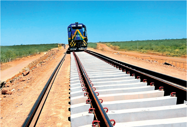
GOVERNO DO PIAUÍ

A primeira etapa do empreendimento – que contempla 1.061 km dos 1.750 km totais planejados – atingiu 76% de avanço físico, com seis lotes em obras e dois ainda pendentes de contratação. O projeto prevê 19 estações interligando os estados do Ceará, Pernambuco e Piauí. O investimento total estimado é de R$ 15 bilhões, dos quais R$ 4,4 bilhões são de recursos fe-