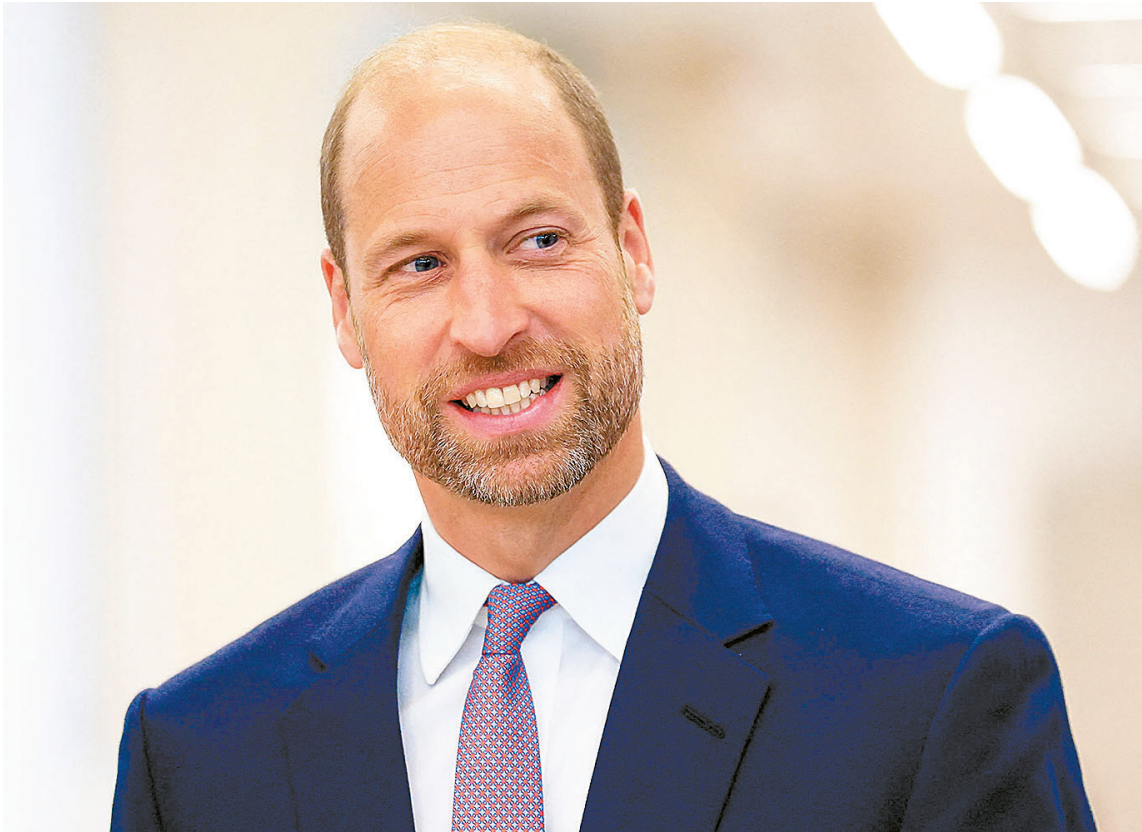
Visita do futuro rei se concentrará no Prêmio Earthshot, iniciativa global criada por ele

O prêmio atribui anualmente um milhão de libras (R$ 7 milhões, na cotação atual) para cinco projetos que abordam ameaças ao meio ambiente. “Com sua energia, seu povo e suas paisagens icônicas, o Brasil é o lugar perfeito para celebrar a incrível inovação ambiental e sediar nosso maior e melhor Earthshot de todos os tempos”, disse o presidente-executivo do prêmio, Jason Knauf.