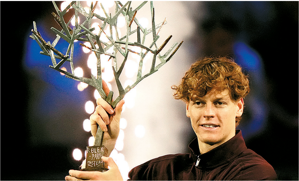
Jannik Sinner é o primeiro jogador da França a levantar a “L’Arbre de Fanti”, nome do troféu

Campeão sem perder um único set na capital francesa, Sinner é o primeiro jogador de seu país a levantar a "L'Arbre de Fanti", nome do troféu do Masters 1000 de Paris. Antes desta final, Auger-Aliassime liderava por três vitórias a duas o retrospecto de confrontos contra Sinner, mas uma delas foi por abandono do italiano.