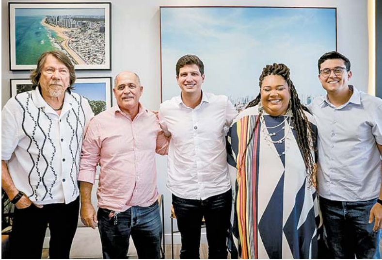
Homenageados visitaram o prefeito do Recife, João Campos