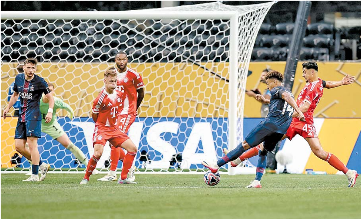
PSG e Bayern se enfrentaram recentemente nas quartas de final do Mundial de Clubes

do Barcelona. Já o Liverpool está apenas em 10º na competição europeia e, no Campeonato Inglês, aparece em terceiro. Os dois duelos terão a presença de diversos brasileiros. No lado do Real Madrid, estarão Eder Militão, Rodrygo e Vinícius Júnior. O clube ainda tem Endrick, pouco utilizado pelo técnico Xabi Alonso. No Liverpool, Alisson se recupera de lesão e não deve entrar em campo. O Paris Saint-Germain conta com Marquinhos e Beraldo.