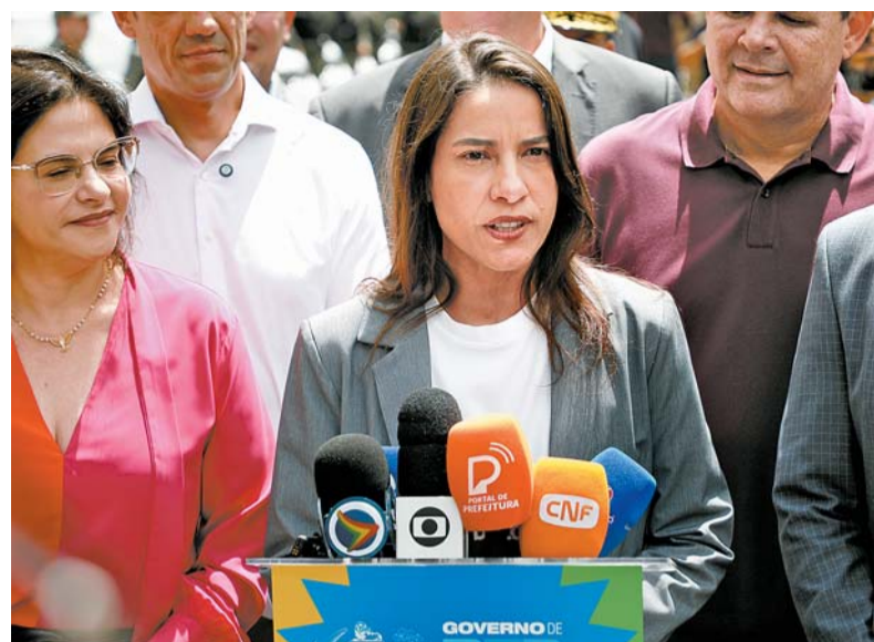
Governadora criticou proposta que dobra valor de emendas

A Federação das Indústrias de Pernambuco (Fiepe) chegou a emitir nota demonstrando preocupação com a proposta, pelo potencial impacto na realização de investimentos considerados estratégicos pelo empresariado do estado. “A mudança abrupta compromete a previsibilidade fiscal e impacta em áreas essenciais ao desenvolvimento econômico e social do estado”, diz um trecho do manifesto divulgado pela Federação.