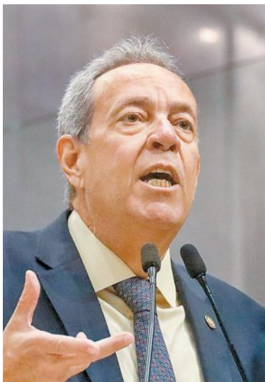
Parlamentar disse que foi criado “quadro artificial”

Presidente da Alepe discursou, em sessão plenária da Casa, para criticar situação da segurança pública. Já gestora garantiu foco em investimento na área e defendeu números do governo