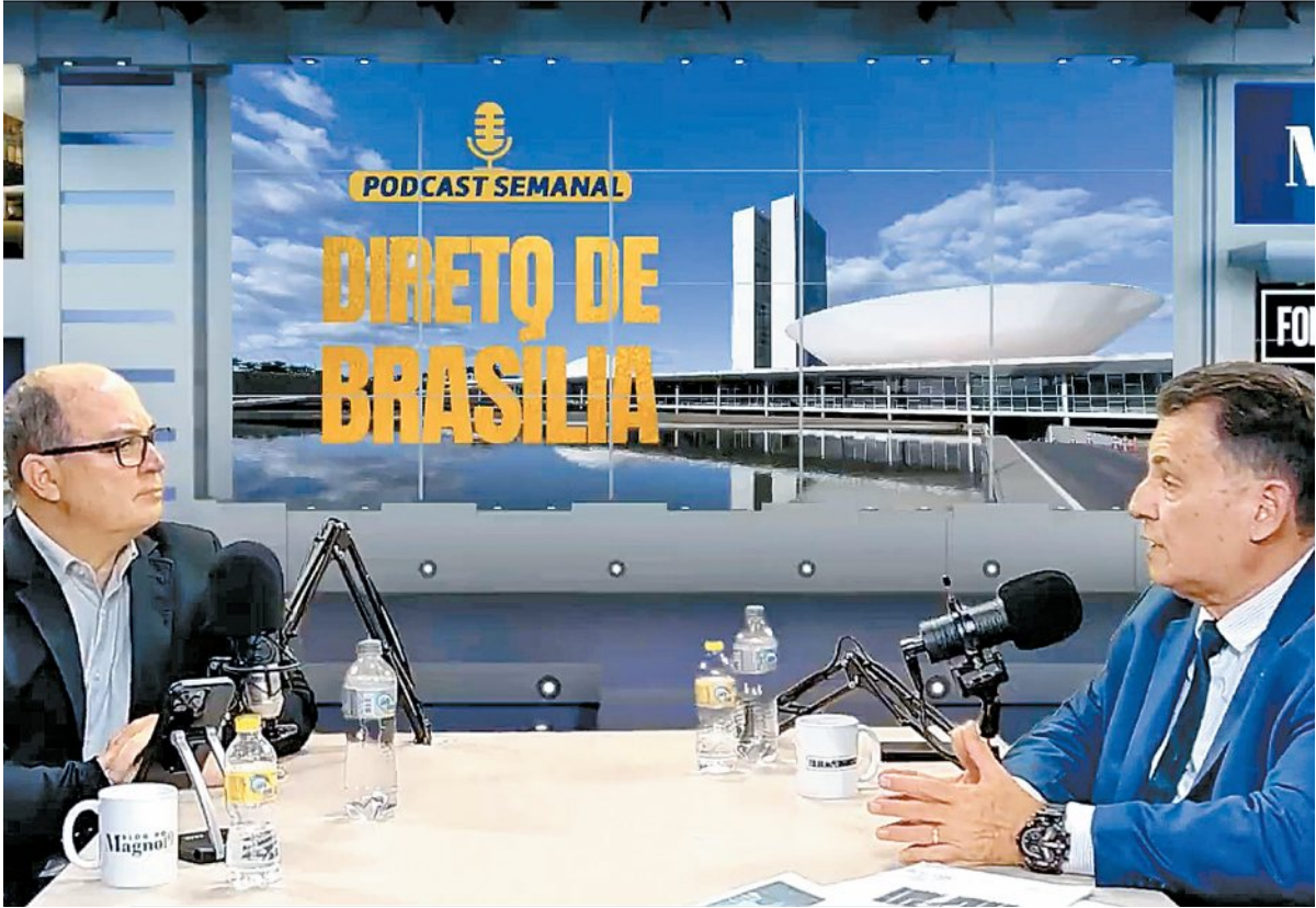
Parlamentar (D) criticou duramente a política de segurança pública do governo Lula