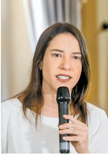
Governadora voltou a cobrar a votação de empréstimo