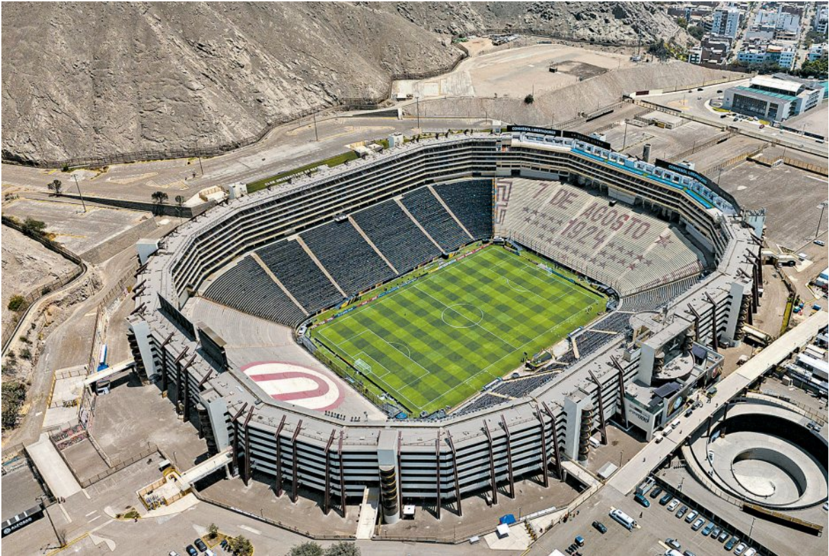
No estádio Monumental, em Lima, Flamengo e Palmeiras se enfrentam em aguardada decisão da Libertadores