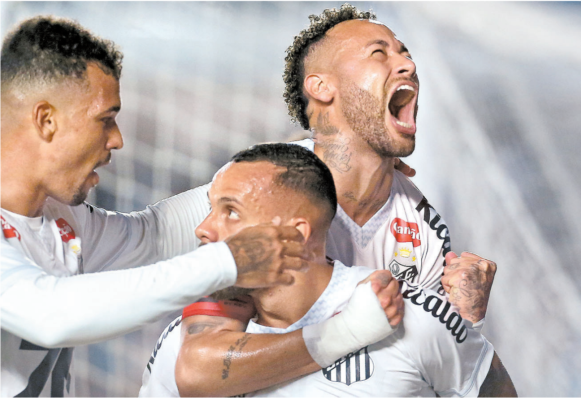
Com gol de Neymar, Santos vence Rubro-negro e respira na luta contra o rebaixamento no Brasileiro

Presafácil, Leão é superado pelo Santos e agora acumula 14 jogos seguidos sem vencer no Campeonato Brasileiro da Série A. Peixe ganha sobrevida na luta contra a degola