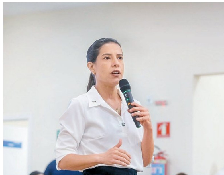
“Vamos deixar a briga menor de lado”, disse a gestora

D4Sign 068c6453-b5a0-495e-9540-36573ffb9cfb - Para confirmar as assinaturas acesse https://secure.d4sign.com.br/verificar Documento assinado eletronicamente, conforme MP 2.200-2/01, Art. 10º, §2. Brasil