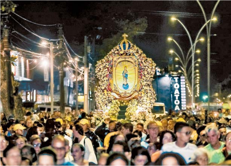
Ruas da Zona Norte da capital pernambucana foram tomadas por fiéis

A programação da 121ª Festa de Nossa Senhora da Conceição segue até o dia 8 de dezembro, data que marca a celebração oficial da padroeira afetiva da cidade.