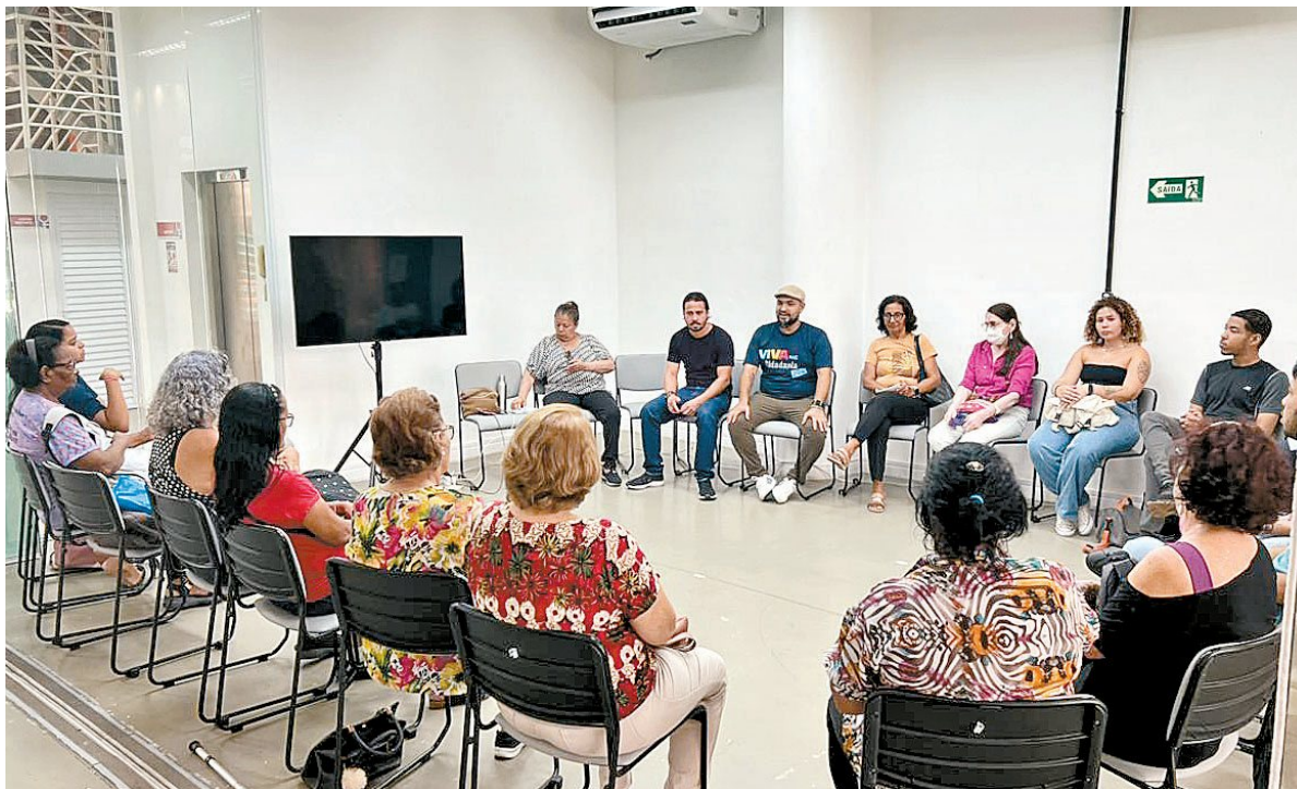
Para promover a inclusão, PCR desenvolveu o programa Viva Mais Cidadania Digital

Com o cenário de cada vez maior utilização de serviços digitais no universo financeiro, o Brasil ainda vive o desafio de promover uma inclusão digital a toda a população. Segundo dados da Pesquisa Na-