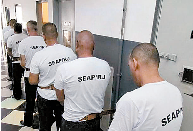
Presos foram levados ontem sob forte esquema de segurança