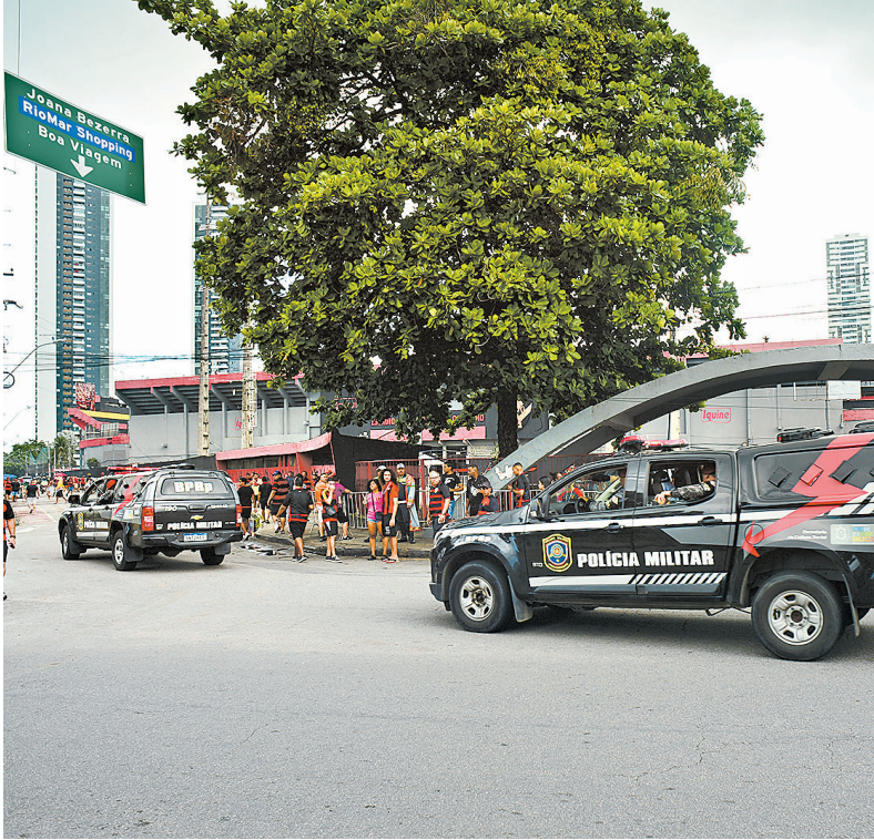
Legislação visa combater violência no esporte

Projeto aprovado na Assembleia Legislativa de Pernambuco prevê a criação de um cadastro para as organizadas e torcedores que cometerem infrações, além de ações de prevenção