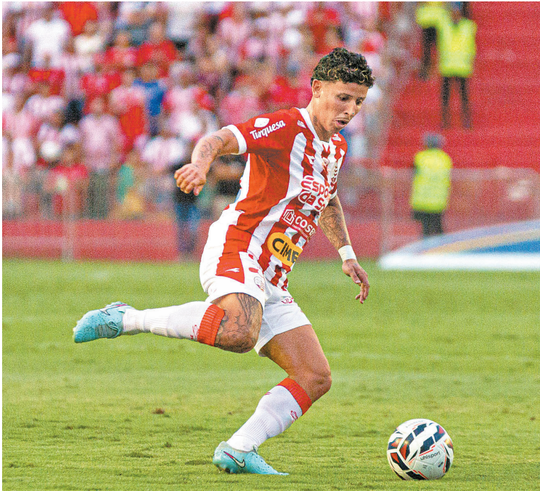
Meia participou de 30 jogos pelo Náutico em 2025