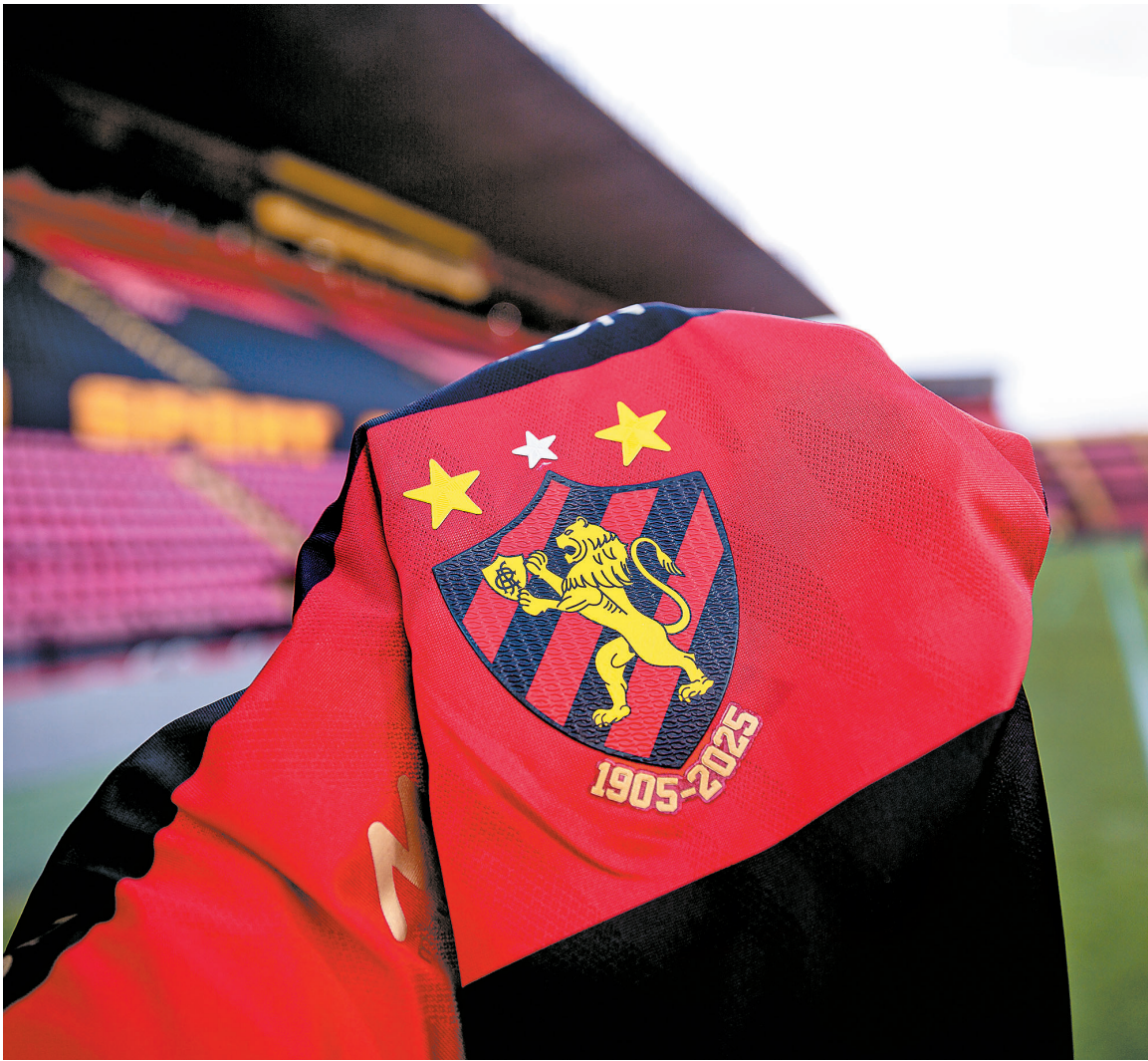
Sport não renovará o contrato com a marca inglesa Umbro , parceira desde 2019

“Não tenho muito o que dizer. A gente precisava do dinheiro, chegou a proposta e eu aceitei. Só tenho agora a dizer uma coisa: pedir desculpas por ter aceitado isso. Não farei mais. Seja Flamengo, Santos ou Vasco. Recebemos até