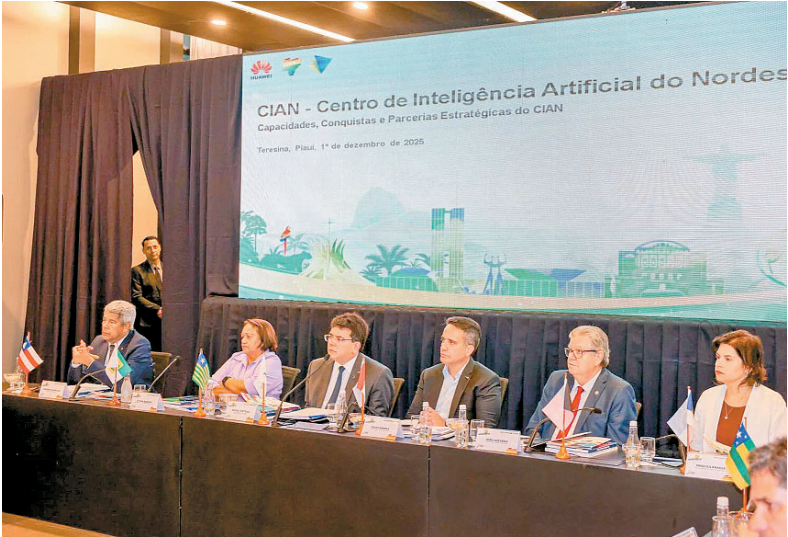
Meta do grupo é formar 40 mil profissionais em três anos