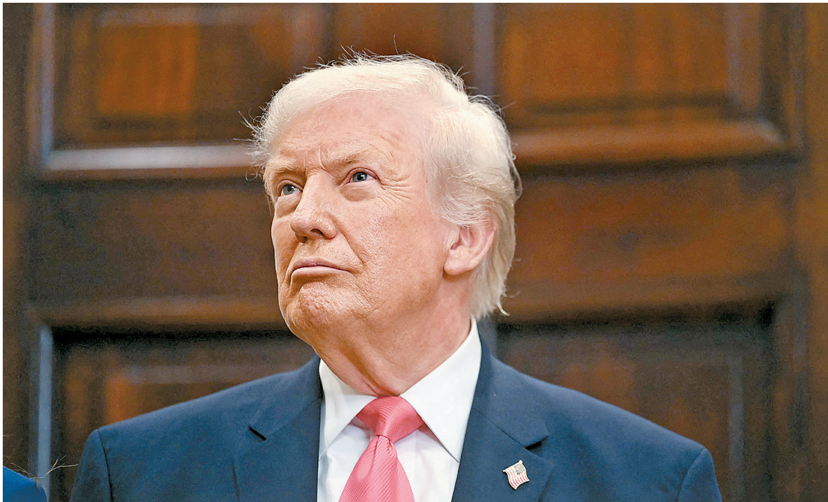
Tarifaço imposto ao Brasil faz parte da nova política da Casa Branca, inaugurada por Trump