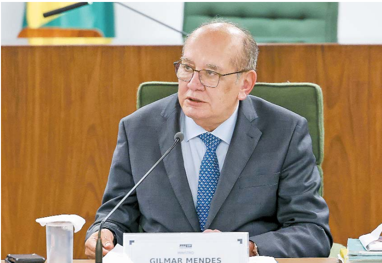
Decisão de Gilmar Mendes será analisada pelos demais ministros

pode apresentar denúncias ao Senado contra ministros do STF e o procurador-geral da República, e que é preciso maioria simples tanto para receber o pedido quanto para considerá-lo procedente. Mendes ainda decidiu que o mérito de decisões judiciais não pode ser utilizado como justificativa para pedidos de impeachment e que os magistrados não devem ficar afas-