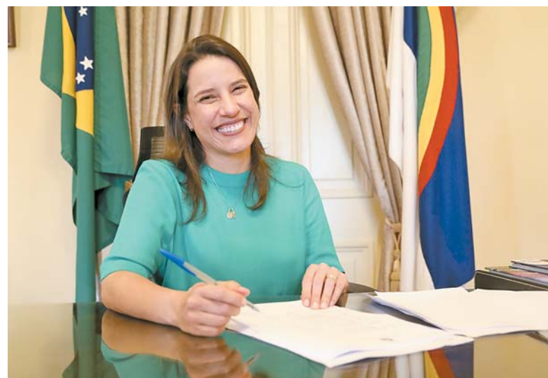
Governadora cobra liberação de empréstimo para benfeitoria

Ordem de serviço para a construção da primeira etapa da obra será assinada no próximo dia 12. Iniciativa é esperada há mais de uma década