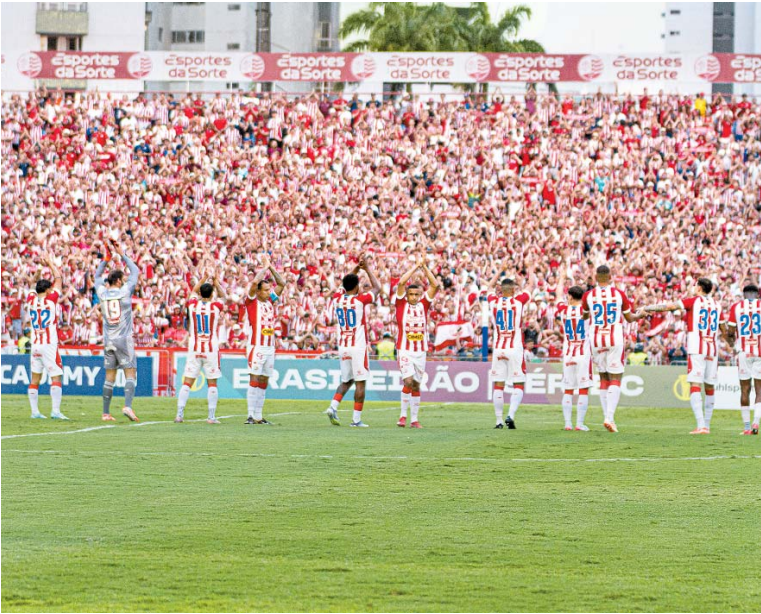
Caso a CBF acate o pedido, o Náutico será bicampeão nacional

No Torneio dos Campeões do Norte de 1952, o Náutico, que já entrou na semifinal, derrotou o América-RN, por 5x4, e a Tuna Luso, por 5x1, para se sagrar campeão. Os outros participantes fo-