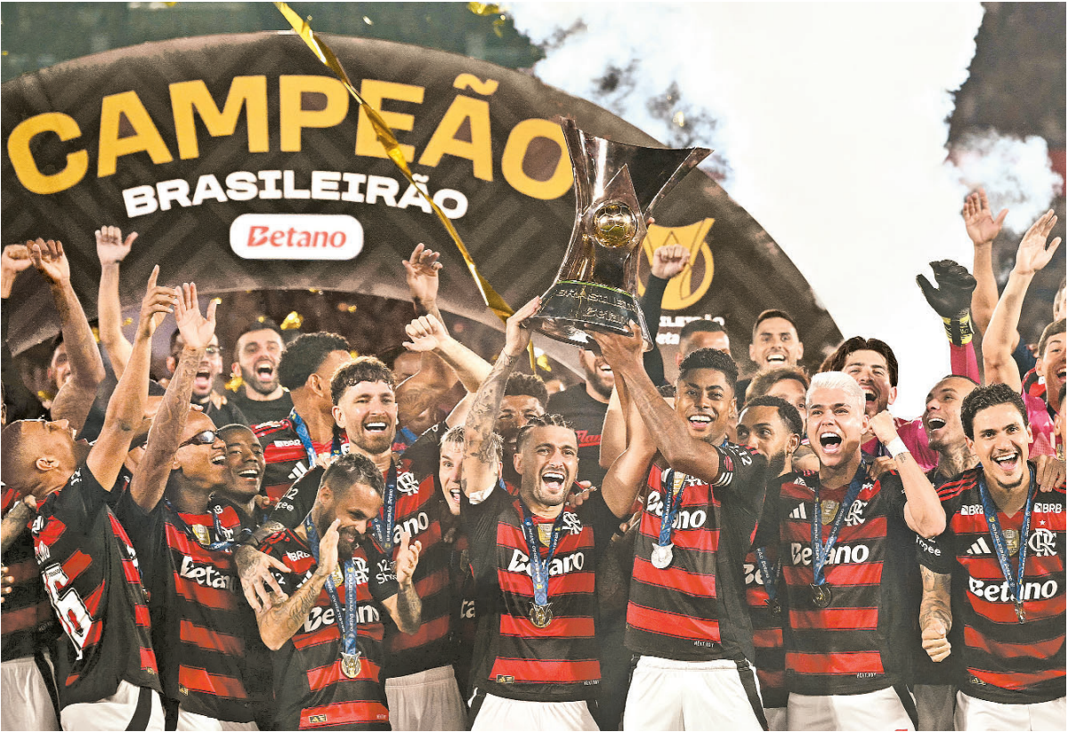
Rubro-negro celebra conquista do Campeonato Brasileiro da Série A ao vencer Vozão no Maracanã

YURI TEIXEIRA T ítulo da Libertadores no último sábado. Título do Campeonato Brasileiro ontem. Tal como em 2019, o Flamengo volta a celebrar em in- tervalo de poucos dias dois dos títulos mais almejados pelos clubes do futebol nacional. Ontem, bastava uma vitória simples para o Rubro-negro conquistar a Série A pela oitava vez na história. Sem dificuldades, venceu o Ceará por