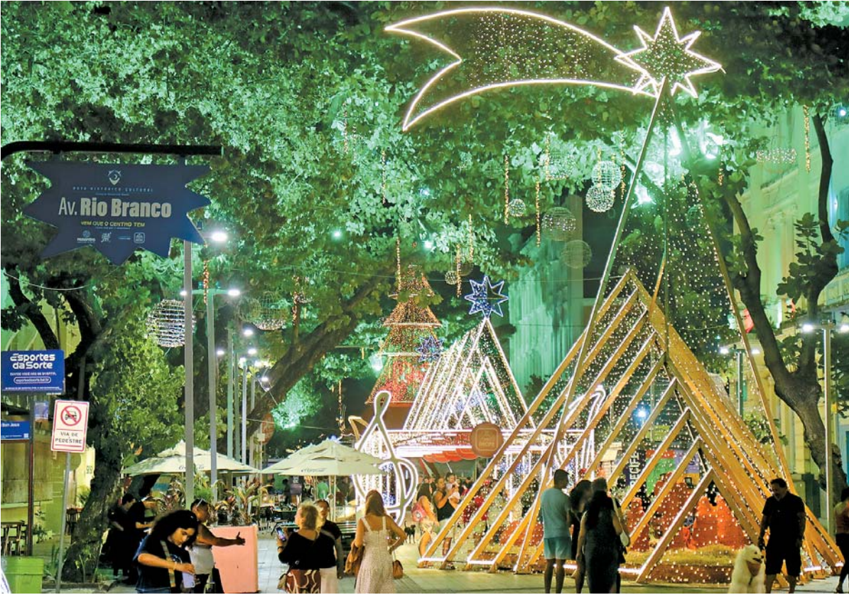
Decoração natalina preparada pela prefeitura começou a iluminar alguns pontos da cidade

Com o tema “Natal dos Sonhos”, decoração natalina já toma alguns pontos da cidade com algumas novidades, entre elas a mudança de local da grande árvore e o equipamento que produz neve de espuma