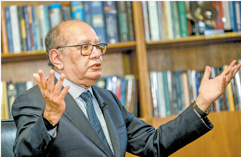
Mendes entendeu que o pedido de reconsideração é incabível juridicamente