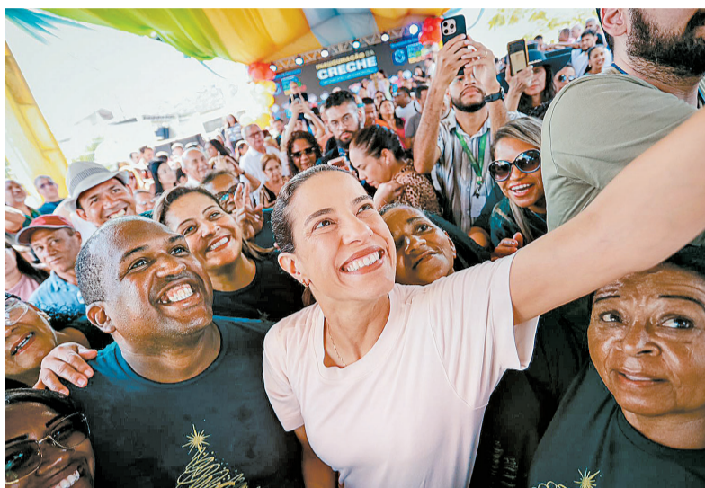
Governadora: "A primeira está entregue, e mais 249 chegarão"

Enquanto a gestora entregou a 1ª das 250 creches prometidas na campanha de 2022, o socialista inaugurou a primeira etapa do Parque Eduardo Campos, no Pina