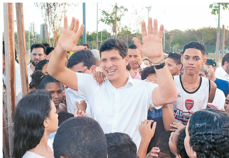
Prefeito: "A gente luta para fazer o que as pessoas esperam"