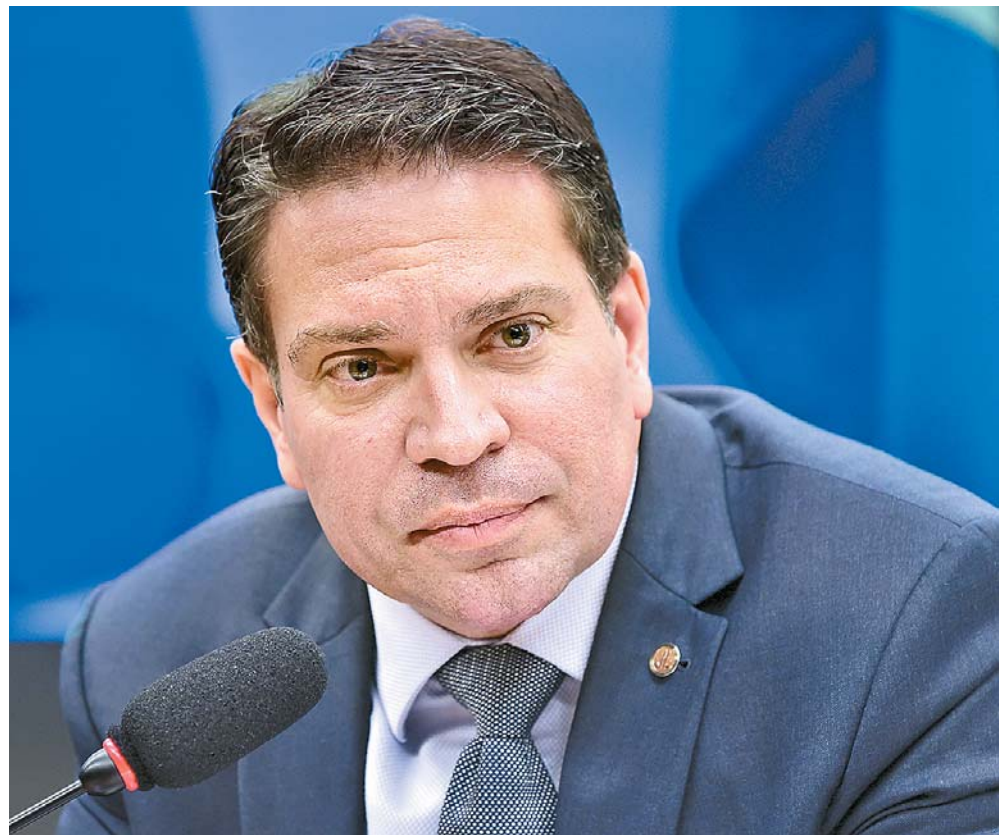
Ramagem perdeu cargo por ter sido condenado por tentativa de golpe de Estado