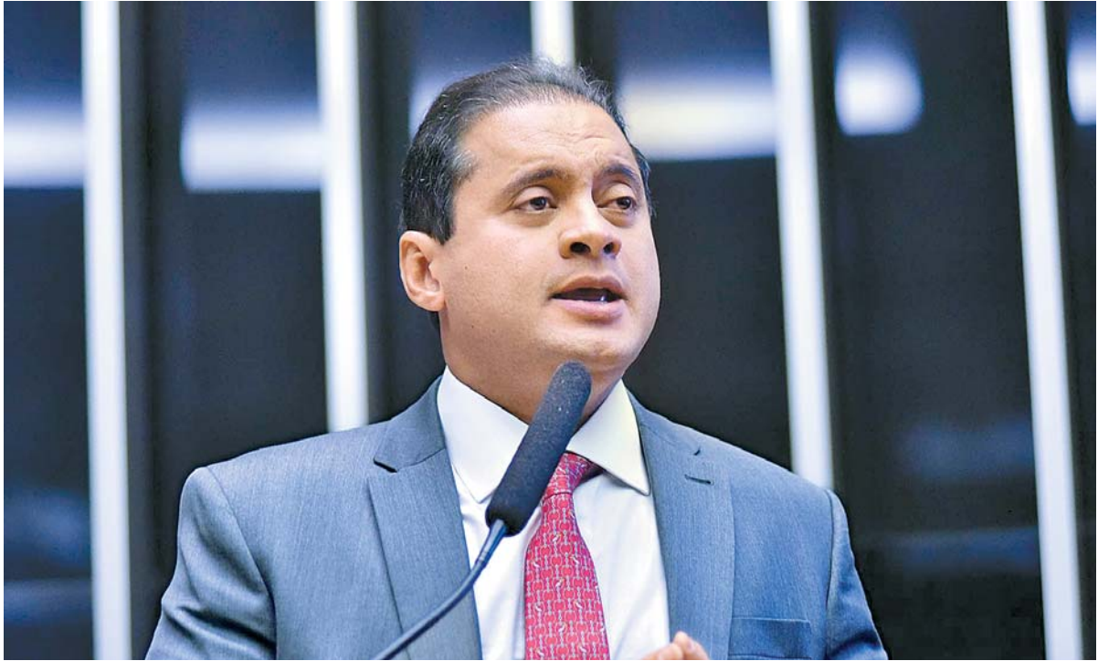
PF solicitou prisão de Weverton Rocha, mas o ministro do STF André Mendonça negou pedido