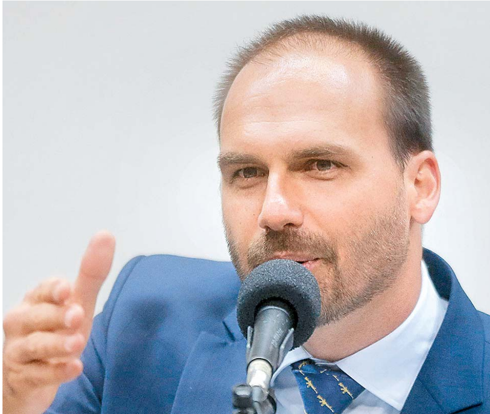
Eduardo Bolsonaro foi cassado por ultrapassar os limites de faltas na Câmara