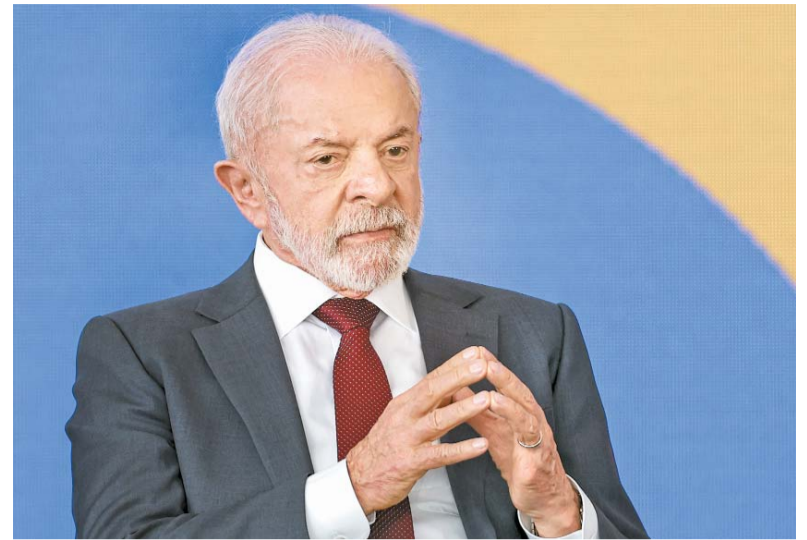
Presidente publicou decisão no Diário Oficial da União de ontem

Em 2023 e 2024, o governo já havia adotado essa postura, impedindo o benefício a réus do 8 de janeiro. Essa vedação aparece na minu-