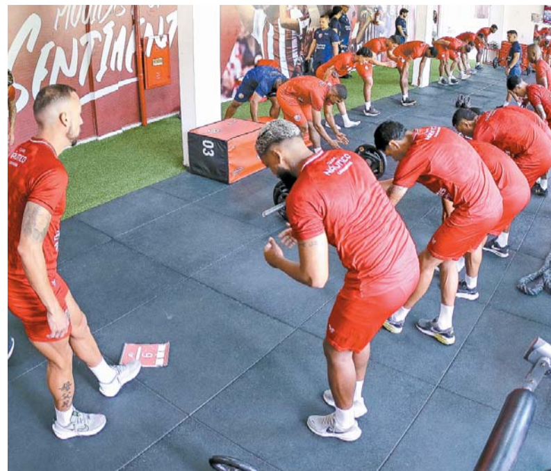
Atletas aprimoram forma física no CT Wilson Campos

Na fase atual, o foco do Náutico está em observar quatro pontos: força, potência, resistência e