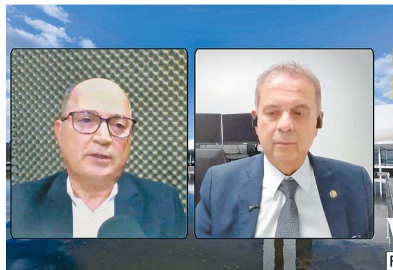
Para senador, pré-candidatura de Flávio Bolsonaro é unificadora

Rogério Marinho negou que a pré-candidatura de Flávio atrapalhe as pretensões da centro-direita, ao contrário do que vem sendo sugerido por atores e analistas políticos. “É importante que a discussão política seja absolutamente cristalina, aberta e franca. A direita tem candidato, que é o Flávio Bolsonaro, que representa a defesa desse legado. A centro-direita, todos sabem, é que normal-