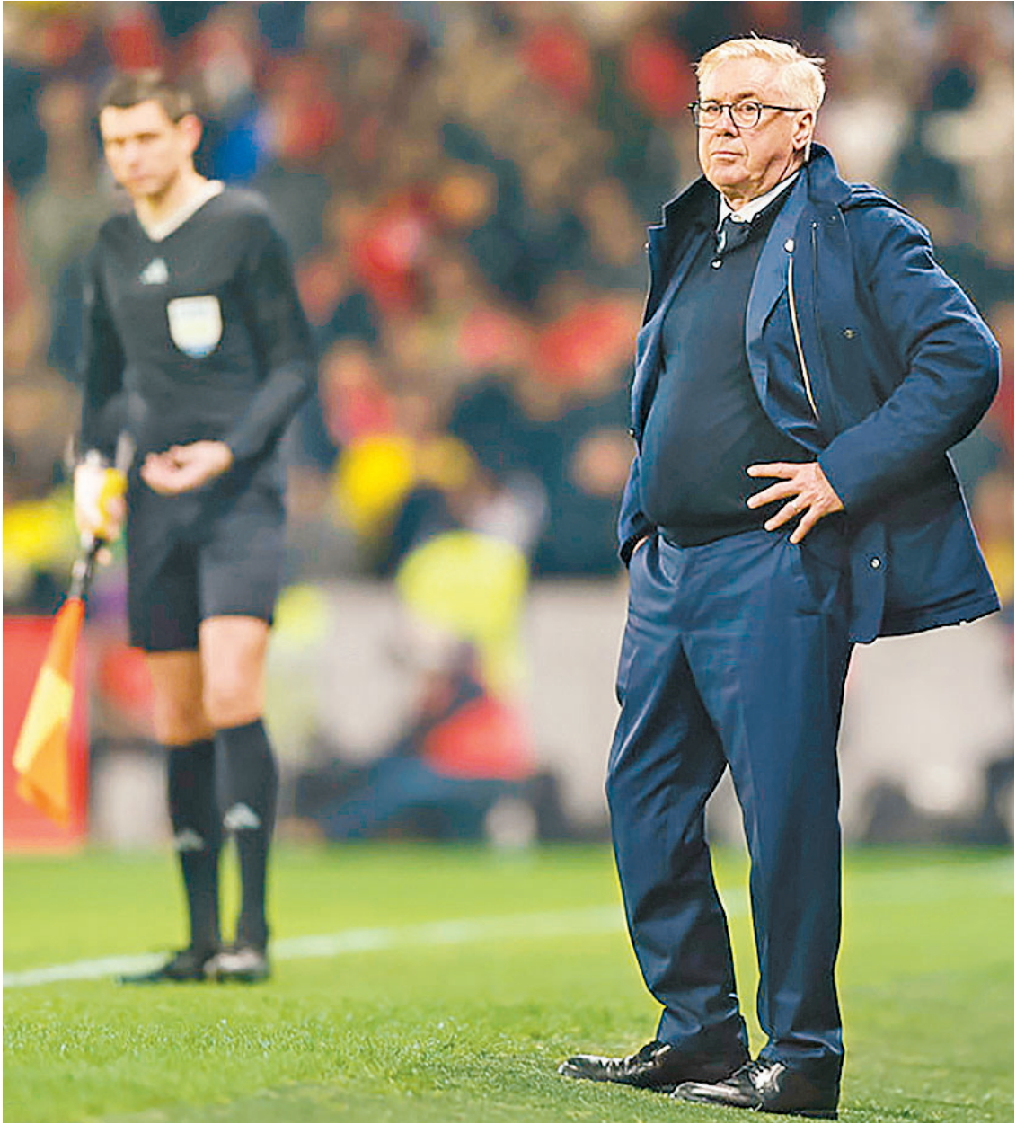
Técnico da Seleção disputou oito jogos pelo Brasil, com quatro vitórias, dois empates e duas derrotas

Embora seja recorrente os elogios que Ancelotti faz aos atletas brasileiro quanto à capacidade criativa, o treinador reforça que não será apenas o dom indivi-