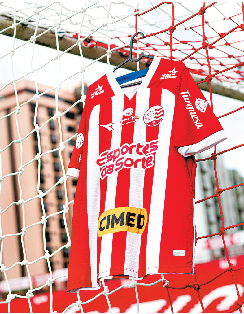
Parceria com Reebok inclui materiais de treino, viagem e jogo

No século, o Náutico teve outros fornecedores de material esportivo. De 2001 a 2005, o Timbu estampava nas camisas a marca da Finta, empresa brasileira. Depois, passou para a Wilson, dos Estados Unidos, nos anos de 2006 a 2008. Em 2009, o clube começou com a Champs e depois passou para a Lupo (ambas brasileiras). Ainda