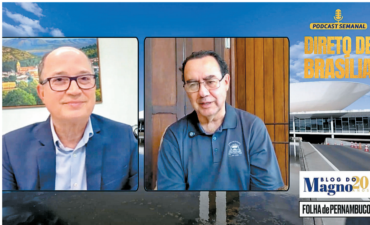
“Muitos candidatos nunca plantaram uma horta e querem decidir o destino da agricultura”

Minha mente tem o melhor do capitalismo, mas meu coração tem o melhor do social. Não o socialismo, o social, porque lidei e tratei da dor das pessoas a vida toda, fiz mais de 20 mil sessões de psicoterapia e atendimentos psiquiátricos. Eu sei o que é a dor, eu vi a dor de perto e quero comunicar para as pessoas que é possível ter um coração social, que cuida dos direitos humanos, que protege as crianças. Quero mostrar que é possível fazer uma política econômica, de Estado, educacional e industrial que contemple os 210 milhões de brasileiros. Acredito que o brasileiro é muito inteligente e vai entender a diferença de uma pessoa que não é radicalizada, que é contra a