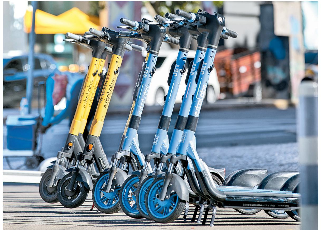
Sistema de patinetes elétricos compartilhado começou a operar no Recife em março

“Está claro que isso vai ter acidente fatal. Estudos na Europa, na Austrália e nos Estados Unidos dizem que, de cada 100 acidentes, 45 são na cabeça. Tem ainda problema com bebida. A gente está vendo menores de idade usando, não têm capacete. Vemos que apenas uma pessoa é permitida, mas