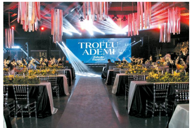
Solenidade reconhece e celebra os destaques do setor

“Assumir a liderança em um momento de resultados tão expressivos é um desafio motivador. Nosso compromisso é continuar elevando o padrão da construção civil pernambucana, destacando projetos que entreguem valor real à sociedade e fortaleçam nossa credibilidade institucional”, afirmou o presidente eleito.