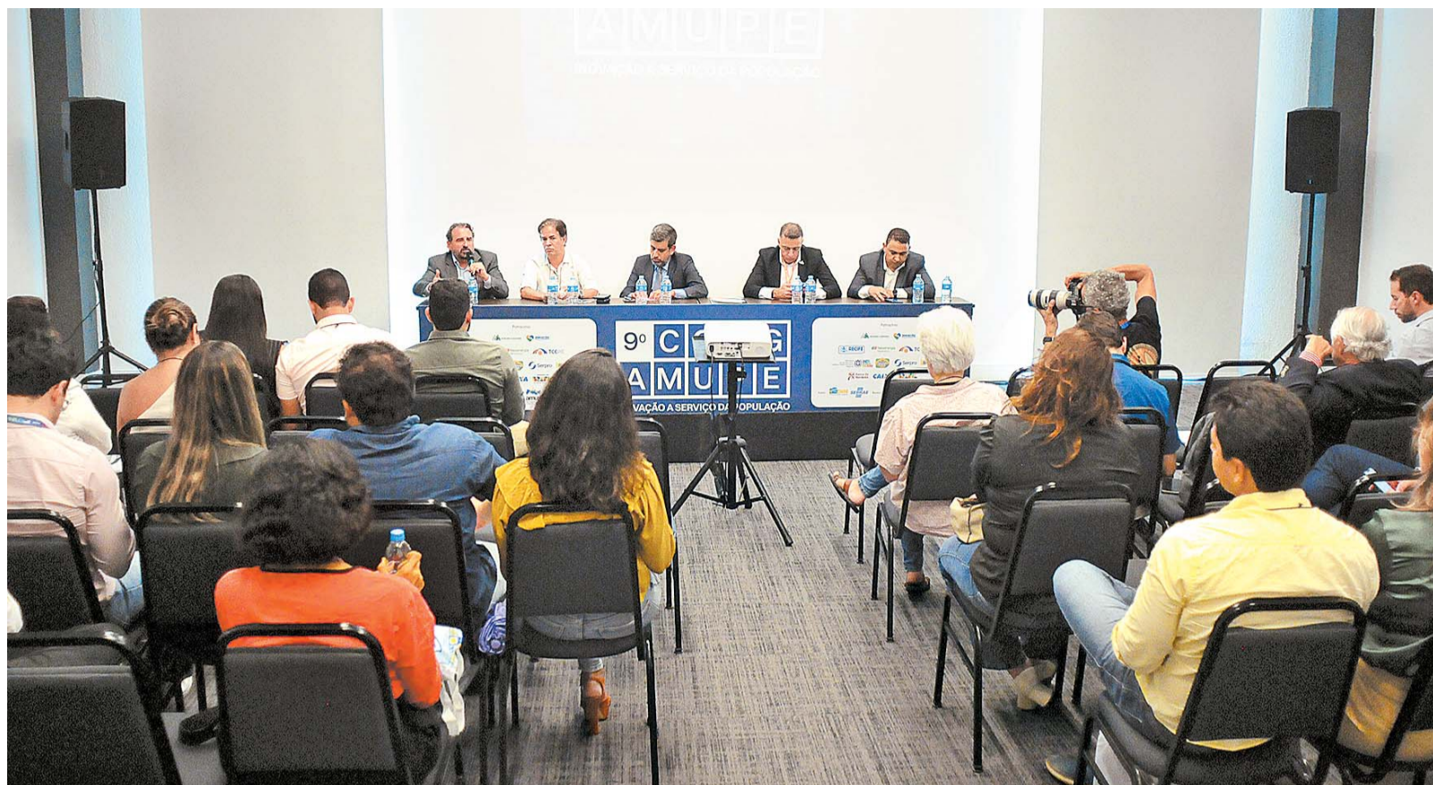
Os detalhes do processo de concessão de parte dos serviços da companhia foram debatidos em congresso da Amupe, ontem