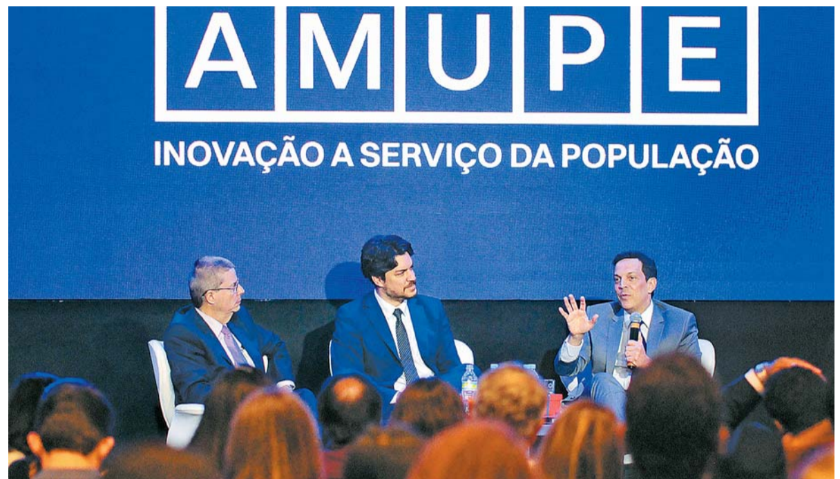
Painel sobre controle externo e boa gestão reuniu ministro do TCU e o presidente do TCE

Já na sala temática “Projetos Estruturadores: Caminhos para o Desenvolvimento Econômico”, gestores públicos e representantes de instituições estratégicas discutiram iniciativas voltadas à geração de emprego, atração de investi-