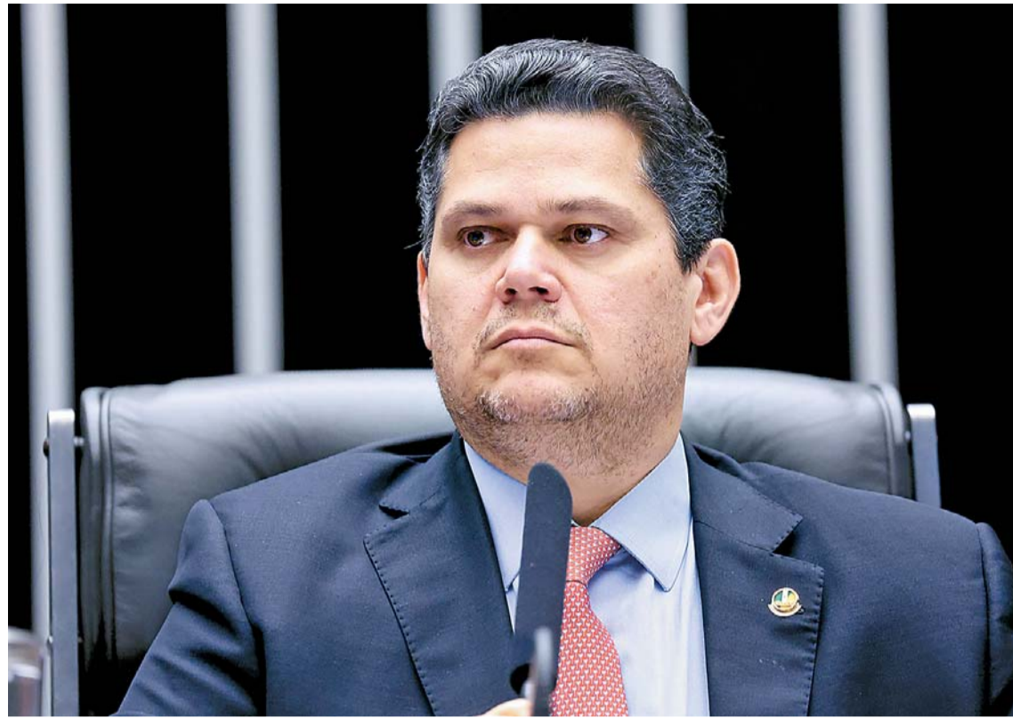
Afastamento entre Alcolumbre e Lula se intensificou após a rejeição de Messias para o STF