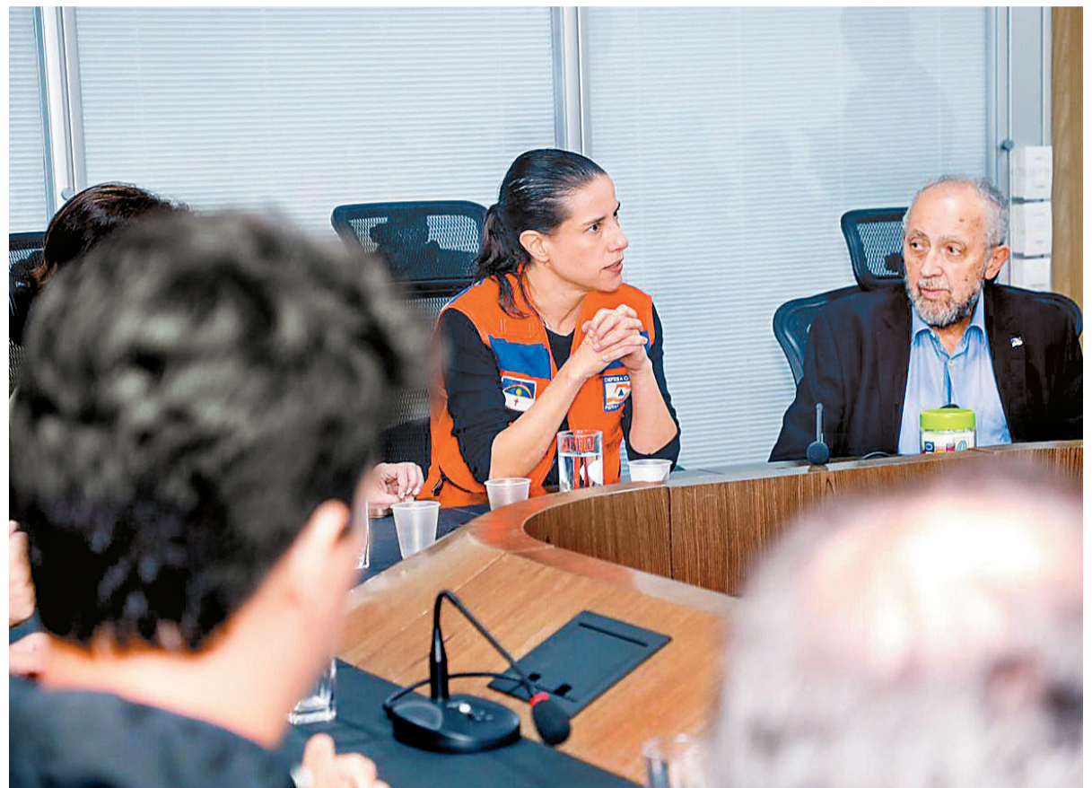
Governadora Raquel Lyra anunciou ontem que o recurso já está na conta das prefeituras

Entre os pedidos estão recursos para a realização de obras de contenção e estabilização de encostas em áreas de alto risco, para obras estruturantes de macrodrenagem e habitação de interesse social.