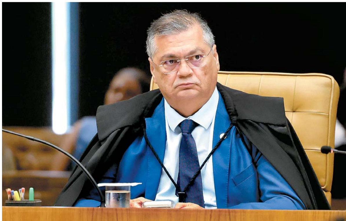
Dino criticou o que chamou de "apagão regulatório" no mercado de capitais na última década

A decisão foi assinada após audiência pública na segunda-feira. Segundo Dino, a partir dos debates se revelou um "quadro inequívoco de atrofia institucional e