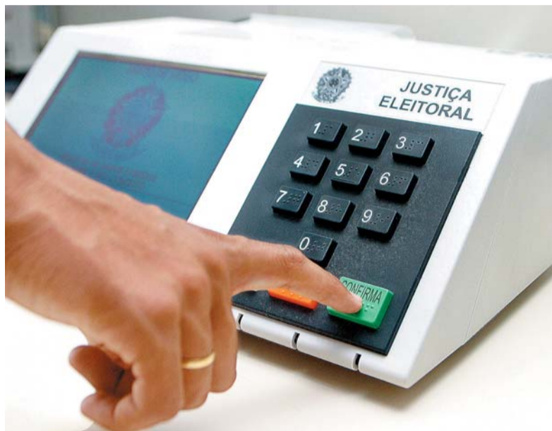
Levantamento ouviu 2.000 pessoas sobre a corrida às urnas

Pesquisa RealTime Big Data divulgada ontem revela o cenário para a disputa presidencial. Pela primeira vez, nome de Ciro Gomes foi incluído no levantamento