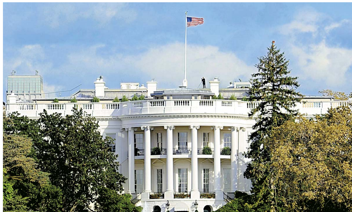
Reunião entre os líderes foi confirmada ontem por um funcionário da Casa Branca

"O presidente Trump receberá o presidente Lula para uma visita de trabalho nesta quinta-feira. Eles discutirão questões econômicas e de segurança de interesse comum", disse ontem o funcionário à AFP sob condição de anonimato.