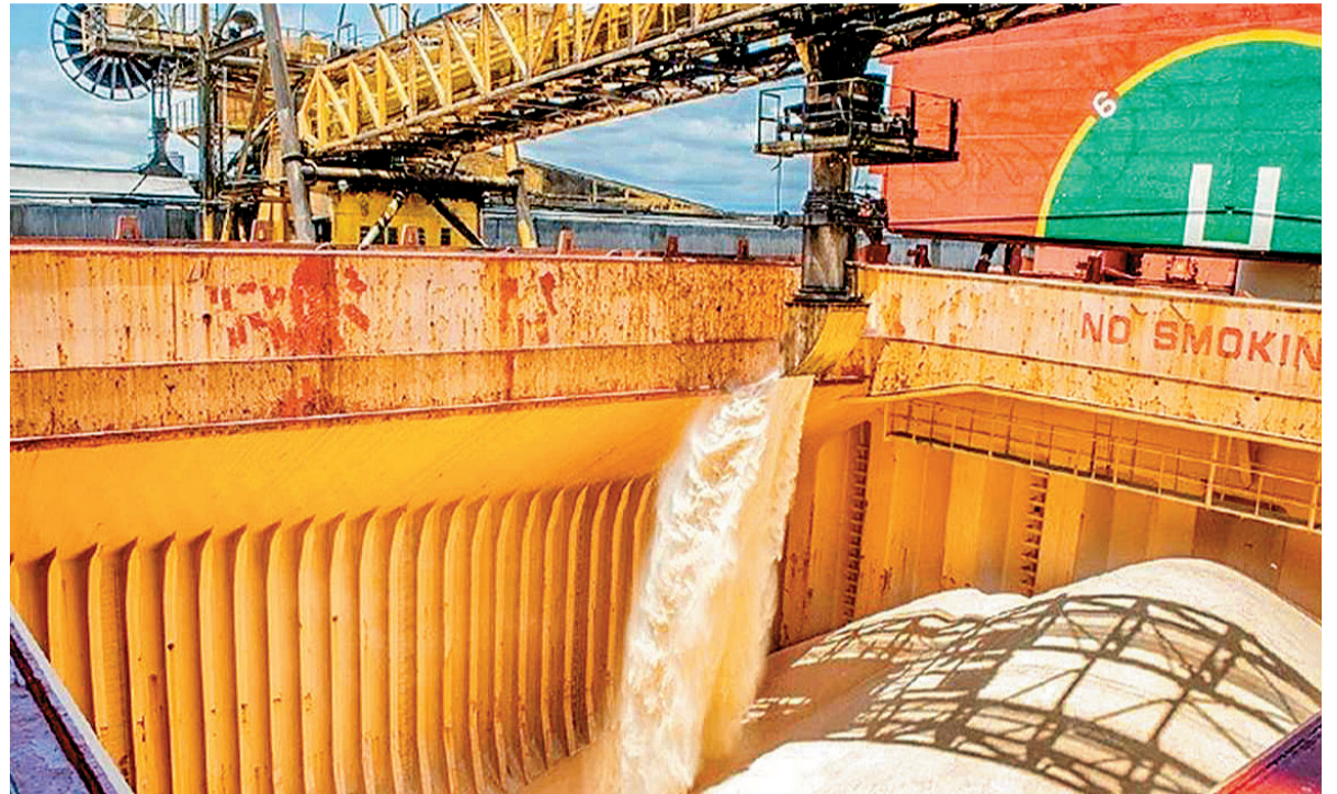
Volumes para o período inicial somam 363.654 toneladas de açúcar e 72.222 toneladas de etanol

O contingente anual destinado à União Europeia para açúcar de cana, posições NCM 1701.13.00 e 1701.14.00, permanece em 363.654 toneladas para o ano-cota 2025/2026. A mudança está na estrutura tarifária: até 30 de abril, toda a cota estava sujeita à tarifa de € 98 por tonelada. Desde 1º de maio, as primeiras 75.000 toneladas exportadas passam a ter tarifa zero. O volume restante, entre 75.001 t e 363.654 t, permanece sujeito à cobrança de € 98/t.