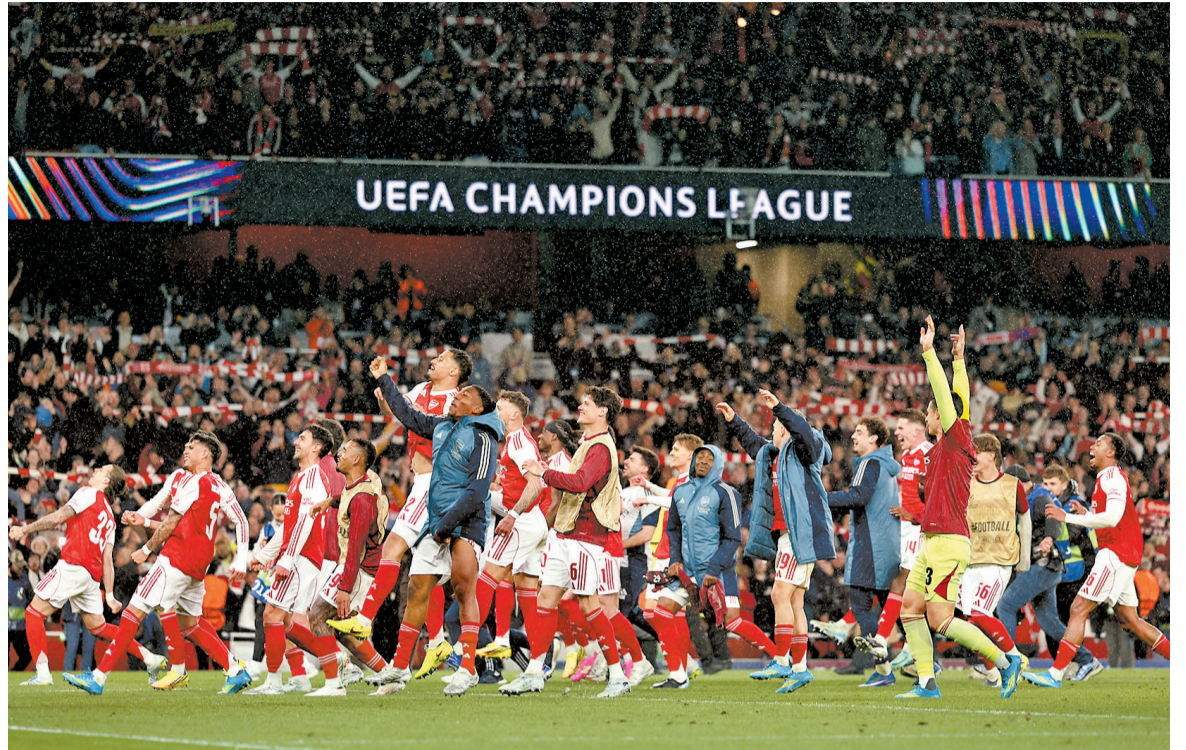
Última vez que o Arsenal chegou em uma final do torneio foi em 2006, perdendo para o Barcelona

Inglêses derrotaram o Atlético de Madrid por 1x0, em casa, pelo jogo da volta da semifinal da Liga dos Campeões. Os Gunners buscam título inédito no torneio