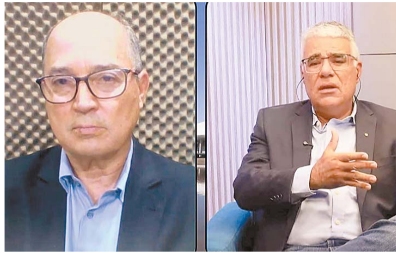
Para Girão, escândalo do Master é maior que o da Lava Jato