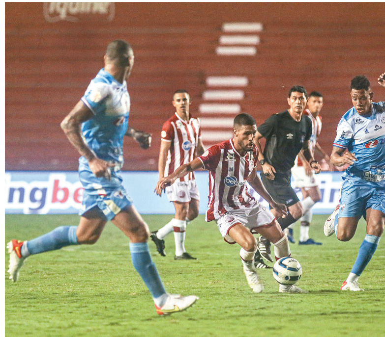
Em 2022, o Náutico ficou no 2x2 com o Fortaleza

A última vez em que o Náutico venceu o Fortaleza foi em 2012. E nem é possível afirmar que os alvirrubros saíram felizes após o jogo. O confronto entre as equipes foi pela Copa do Brasil. Na ida, os cearenses venceram por 4x0, no Presidente Vargas.