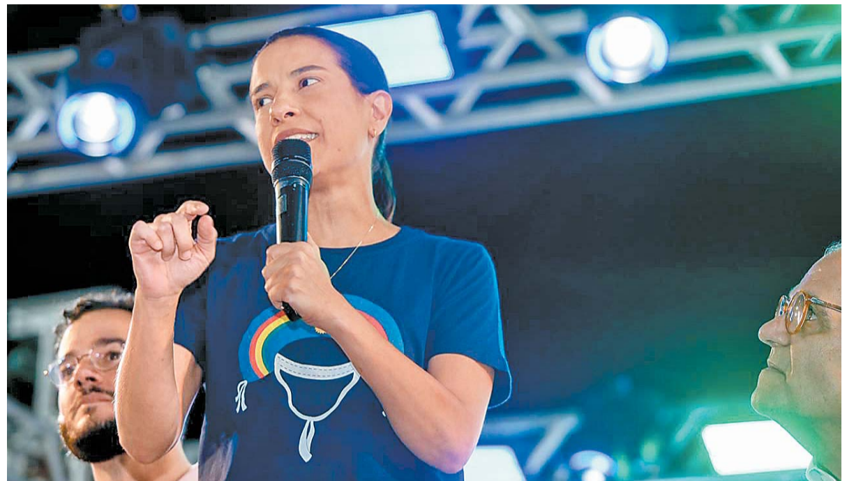
“Estamos garantindo apoio a quem produz, gera emprego e movimenta a economia do estado”

O fertilizante NPK 14-00-18 foi selecionado com base em critérios técnicos e recomendações agrônô-