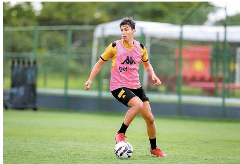
Meia Biel destacou o trabalho tático dos atacantes

Com 22 pontos, início do Sport na competição supera campanhas que terminaram com o acesso à Série A