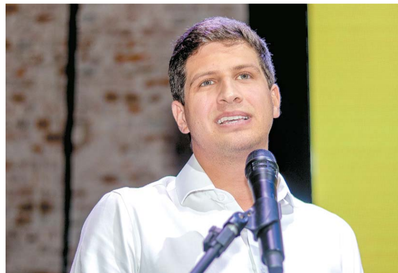
João defendeu o Pix como “conquista do povo brasileiro”

“Trump odeia o meio ambiente. Nega o aquecimento global. Retirou os Estados Unidos de todos os