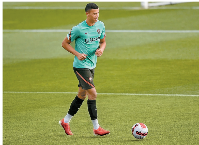
Matheus Nunes disputará o segundo Mundial por Portugal

Três jogadores nascidos no Brasil representarão outras seleções na disputa da Copa do Mundo de 2026: Matheus Nunes (Portugal), Maurício (Paraguai) e Lucas Mendes (Catar)